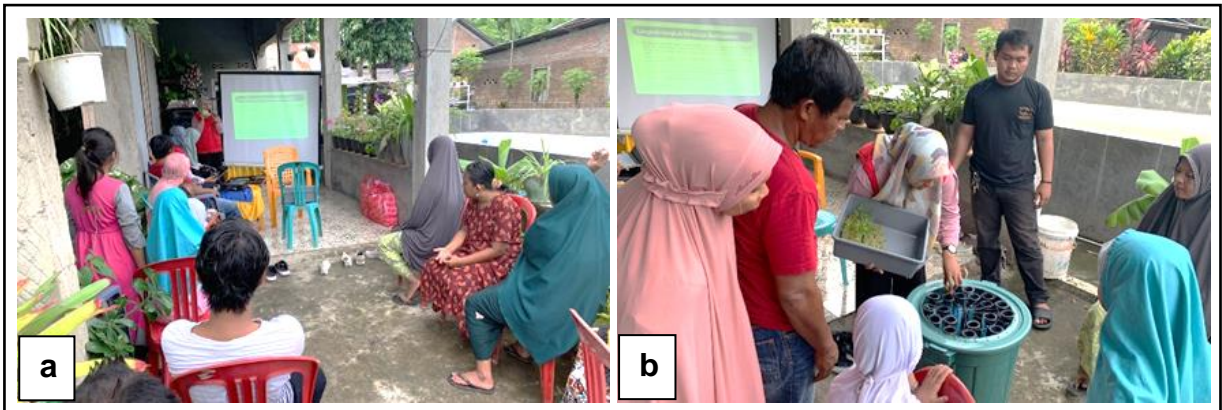
Gambar 1. Pelaksanaan Kegiatan (a) Sosialisasi Sistem Budidaya Aquaponik dan (b) Praktik Langsung dan Perakitan Sistem Budidaya Aquaponik dengan Wadah Ember.

ini bertujuan agar budidaya dengan sistem aquaponik dapat berjalan lancar sehingga peserta dapat menghasilkan hasil panen kangkung dan ikan lele yang berkualitas.