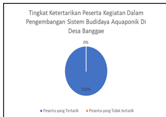
Gambar 4. Tingkat Ketertarikan Peserta Kegiatan dalam Pengembangan Sistem Budidaya Aquaponik di Desa Banggae.

Gambar 4 menunjukkan tingkat ketertarikan peserta kegiatan dalam pengembangan sistem budidaya aquaponik. Hasil