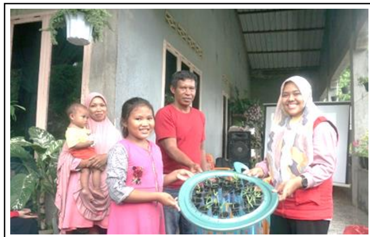
Gambar 2. Penyerahan Rakitan Sistem Budidaya Aquaponik Percontohan kepada Ketua Kelompok Budidaya Air Tawar Desa Banggae.

dengan wadah ember kepada Ketua Kelompok Budidaya Air Tawar sebagai percontohan sistem budidaya aquaponik di Desa Banggae (Gambar 2).