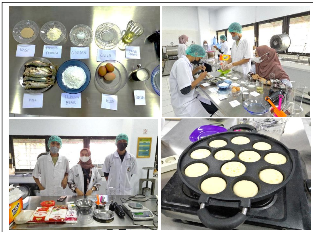
Gambar 2. Pembuatan Surabi Skala Laboratorium.