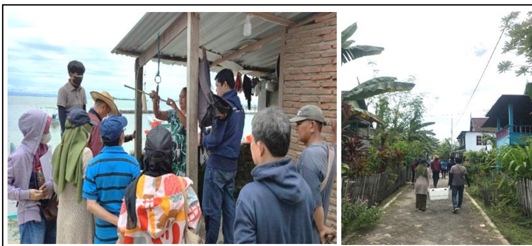
Gambar 1. Suvei dan Persiapan Lokasi.