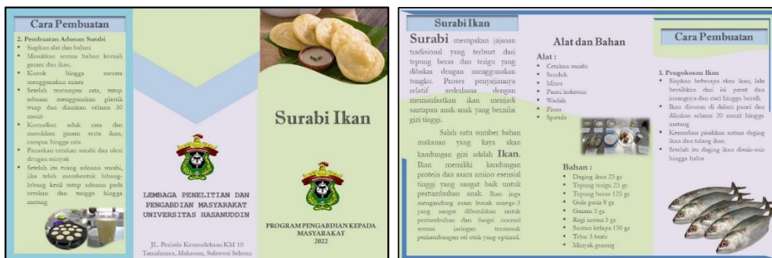
Gambar 4. Leaflet Produk Surabi.