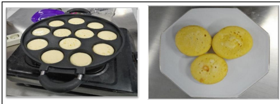
Gambar 3. Prototype Produk Surabi.

hingga menjadi petunjuk dalam memproduksi surabi (Gambar 4).