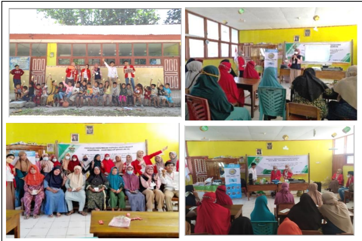
Gambar 5. Sosialisasi dan Pelatihan.

Hal ini dimaksudkan agar dapat memudahkan ketika ingin melihat cara produksi surabi dalam bentuk video. Kegiatan ini pula dipublikasikan di media massa elektronik.