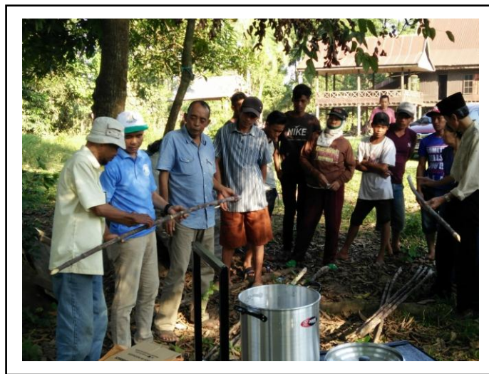
Gambar 6. Demonstrasi Teknologi Pembibitan Bud Chip

tersebut karena merupakan metode baru yang bermanfaat dan membantu petani tebu rakyat dalam perbanyak tanaman tebu. Untuk memberikan contoh kepada kelompok mitra dan meningkatkan motivasi dalam penggunaan teknik pembibitan bud chip , maka sebuah demonstrasi plot dibuat sebagai acuan kelompok mitra untuk hasil dari pembibitan tebu (Gambar 7).