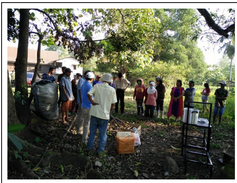
Gambar 5. Penyuluhan Teknis Tentang Pembibitan Bud chip

Pada kegiatan penyuluhan (Gambar 5), tim menyampaikan materi teknis tentang metode bud chip . Peserta diberi informasi teknis dan pengetahuan serta keterampilan menggunakan mesin bud chipper yang telah dibuat