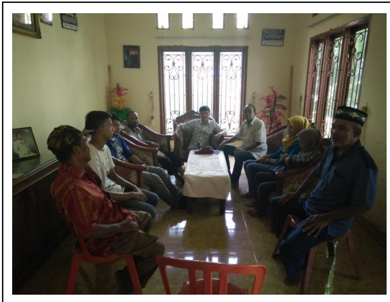
Gambar 4. Focussed Group Discussion (FGD) dengan perwakilan kelompok tani mitra