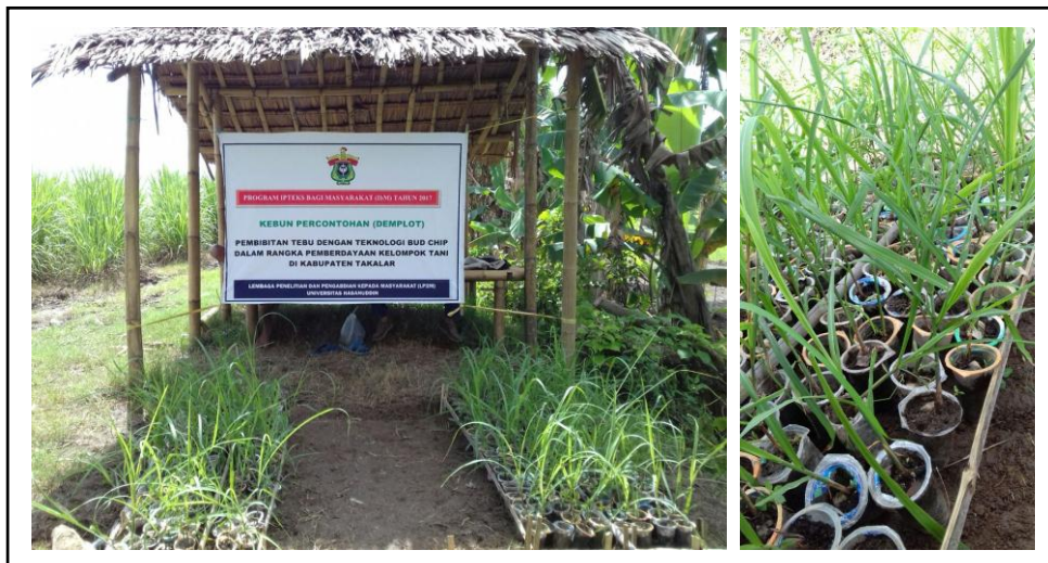
Gambar 7. Demplot Pembibitan Tebu Metode Bud chip Pada Kelompok Mitra