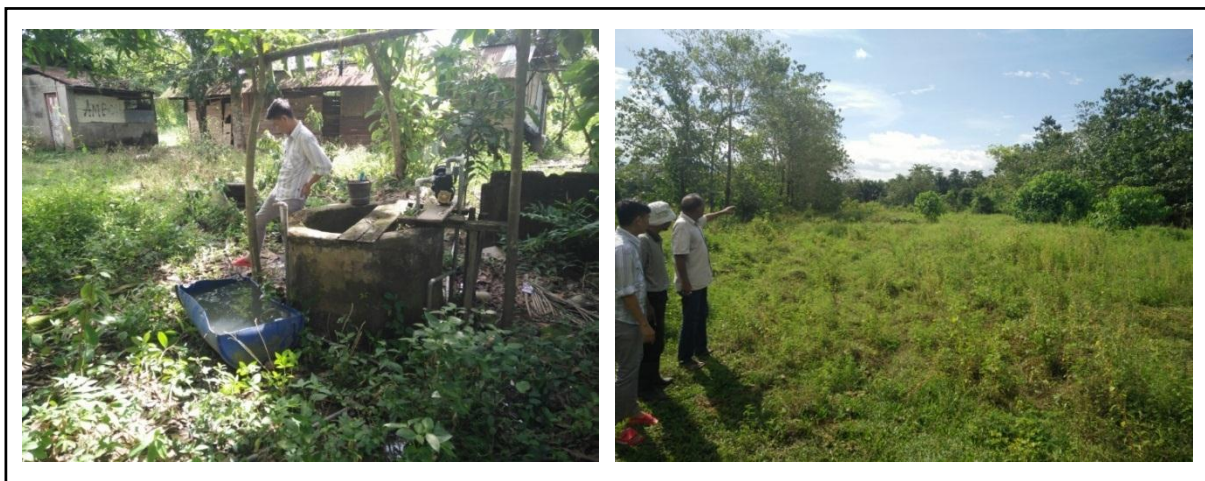
Gambar 3. Survei Lokasi untuk Pembibitan Tebu Bud chip di Lokasi Mitra

usahatani bagi petani tebu. Diharapkan dengan kegiatan ini, petani memiliki minat dan kemampuan untuk menerapkan teknologi baru yang lebih modern, memiliki prospek masa depan dalam memproduksi bibit tebu bermutu untuk mendapatkan produksi yang optimal sehingga keuntungan besar bisa dicapai.