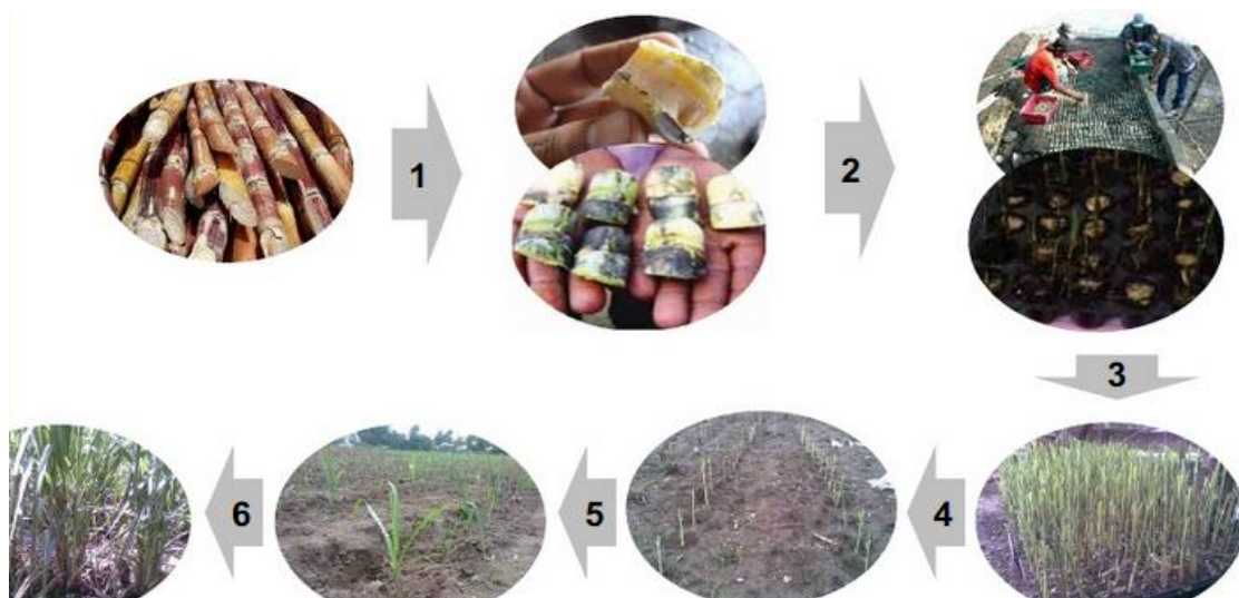
Gambar 1. Skema alur singkat pembibitan tebu dengan metode bud chip

Metode yang digunakan pada kegiatan ini adalah model pembelajaran orang dewasa melalui penyuluhan, pelatihan, pembinaan dan pendampingan, demonstrasi simulasi teknologi serta praktik praktis kepada kelompok mitra. Untuk pencapaian sasaran pembelajaran dilakukan pendekatan partisipatif secara terstruktur kepada kelompok mitra agar aktif dan antusias untuk mengikuti semua rangkaian kegiatan pengabdian.