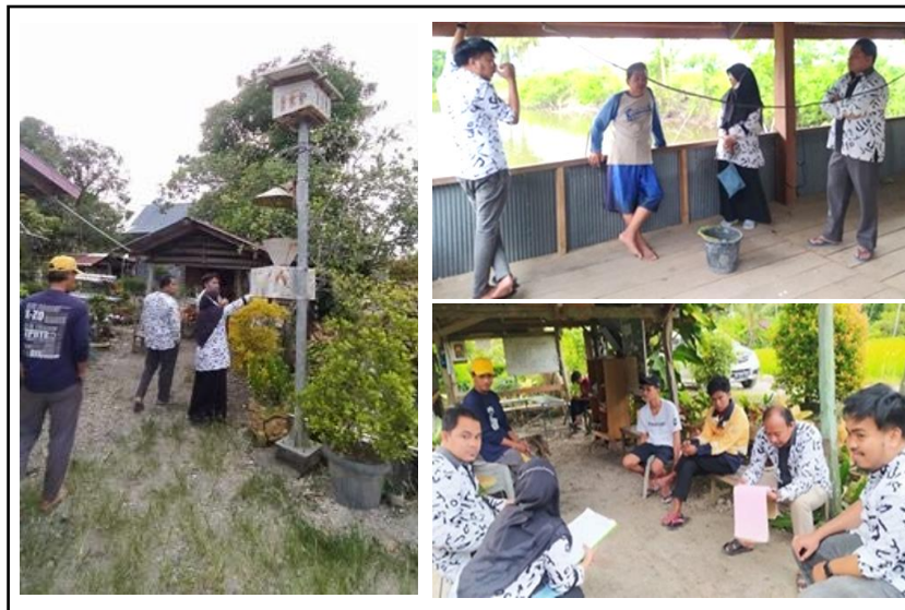
Gambar 2. Kegiatan Observasi dan Survey Lokasi.