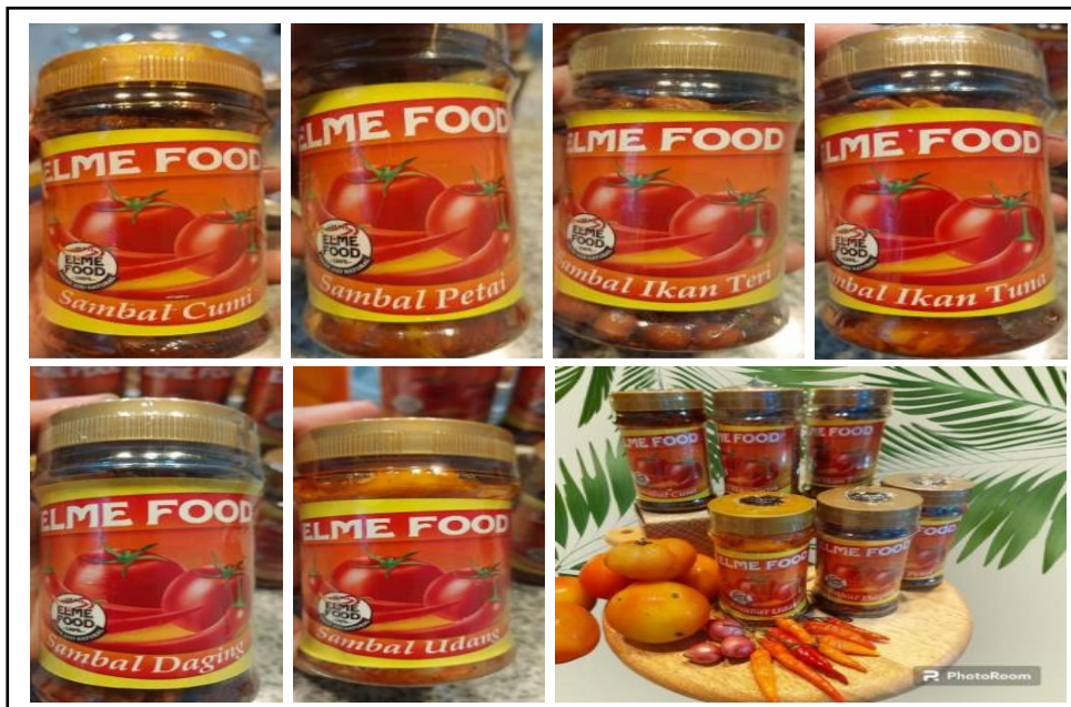
Gambar 3. Pengemasan/packaging produk.

rintah dan perorangan. Selain itu juga dilakukan Online marketing , yakni dengan memperkenalkan produk melalui media online, seperti whatsapp, instagram, dan media online lainnya (Gambar 4).