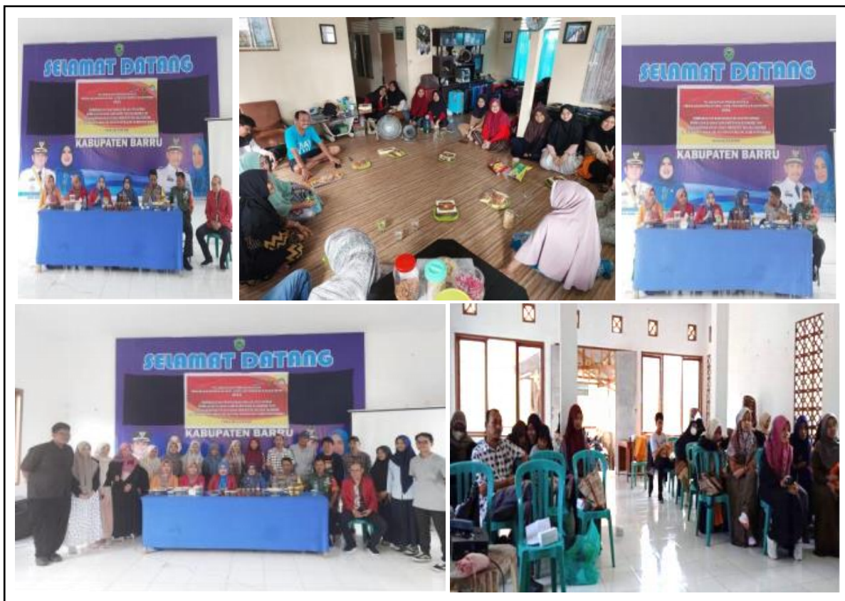
Gambar 1. Seminar Program Kerja.

Kelurahan Takkalasi. Materi yang disampaikan pada seminar ini adalah 3 program kerja utama PKM-UH yaitu pengolahan cabai rawit, tahap pengepakan (packaging) dan pemasaran (marketing). Proses penyuluhan dilakukan secara sederhana, dimulai dengan pemaparan dari penyuluh, tim peneliti serta koordinator desa, kemudian dilanjutkan dengan diskusi dan tanya jawab oleh pemateri dan peserta seminar. Kegiatan diikuti oleh mitra kelompok tani sebanyak 30 petani dan masyarakat setempat yang sebagian besar terdiri dari ibu-ibu petani (Gambar 1).