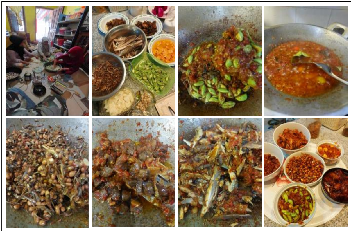
Gambar 2. Demo produk pengolahan cabai rawit.

Kegiatan ini dapat dilihat pada Gambar 2. Kegiatan demo pengolahan cabai rawit di Kelurahan Takkalasi berlangsung dengan sukses, ditandai dengan antusiasme ibu ibu dalam mengikuti setiap proses pengolahan cabai rawit. Kegiatan pengolahan cabai rawit menjadi berbagai produk turunan dilakukan dengan mengadakan sosialisasi dan demonstrasi sebanyak dua kali di dua tempat yang sama.