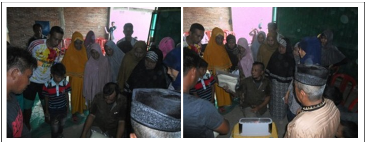
Gambar 4. Praktek mengemas beras dengan metode vakum