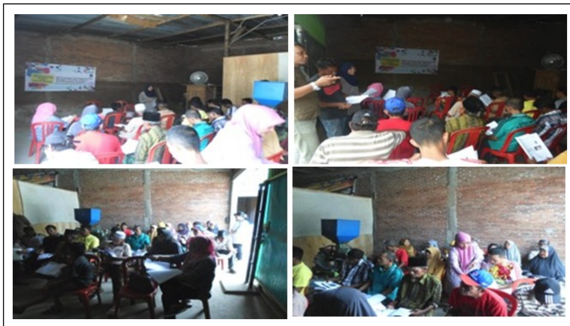
Gambar 2. Ceramah dan diskusi

Tahapan-tahapan kegiatan di atas merupakan tahapan kegiatan yang perlu dilakukan agar beras yang dikemas vakum merupakan beras yang bermutu baik sesuai dengan Standar Nasional Indonesia (SNI), dimana derajat sosoh, persentase beras kepala, beras patah dan beras menir merupakan beberapa syarat beras digolongkan bermutu baik.