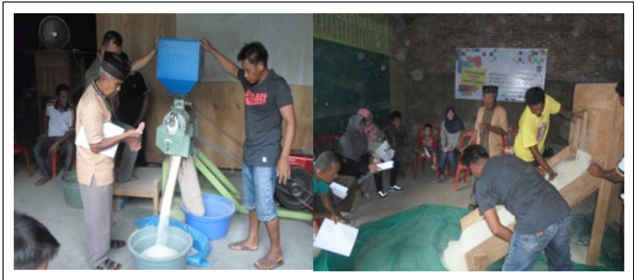
Gambar 3. Praktek menyosoh dan menampi beras