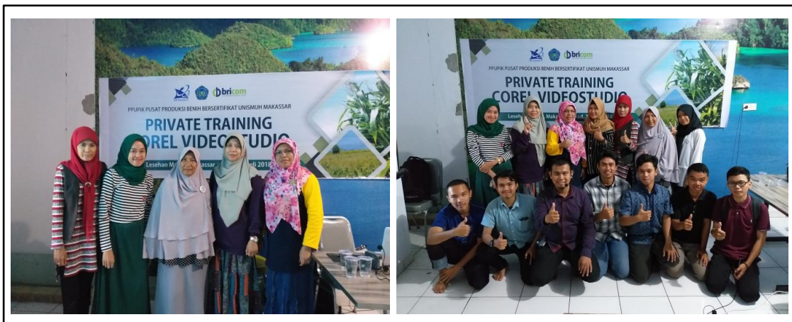
Gambar 3. Foto peserta pelatihan dengan pemateri

Sesi kedua adalah praktek atau berkarya. Semua peserta (Gambar 3) membuat dua 2 karya yaitu mengedit video dengan menggunakan gambar dan mengedit video dengan menggunakan kombinasi gambar dan video. Setelah karya selesai peserta mempraktekkan cara menyimpan video dalam format MPEG-4.