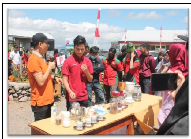
Gambar 1. Pelatihan Barrista bagi Pengunjung Festival Kopi

teknik penyeduhan kopi serta mendeskripsi-kan perbedaan jenis kopi Arabika dan Robusta.