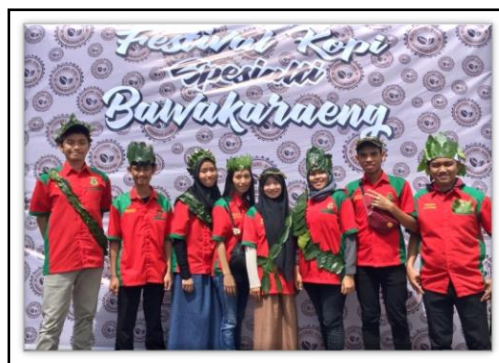
Gambar 4. Photobooth untuk pengunjung.

Festival mendapatkan respon yang cukup besar baik dari petani dan pelaku bisnis kopi maupun dari pengunjung yang khusus datang untuk menghadiri kegiatan ini. Beberapa waktu sebelum pelaksanaan, publikasi online kegiatan festival kopi ini telah dilakukan (Gambar 5). Kegiatan ini dihadiri diantaranya tamu undangan yaitu, Bupati