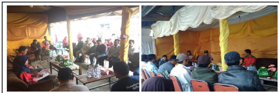
Gambar 6. Suasana FGD Perkopian Spesialti Bawakaraeng saat Festival Kopi.

dan akses kredit. Selain tema utama, peserta FGD juga membahas tentang permasalahan perkopian yang dihadapi petani daerah Bawakaraeng (Gambar 6).