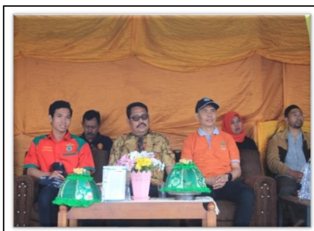
Gambar 2. Asisten II Bidang Administrasi Pembangunan Daerah Tingkat II Gowa.

Kegiatan festival dibuka secara simbolis oleh Bupati Gowa yang diwakili oleh Asisten II Bidang Administrasi Pembangunan Daerah Tingkat II Gowa (Gambar 2). Kegiatan diramaikan dengan beberapa tenant pameran produk kopi Bawakaraeng dengan menyuguhkan seduhan kopinya