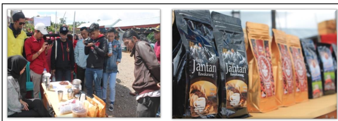
Gambar 3. Tenant pameran produk kopi Bawakaraeng.

kopi gratis kepada pengunjung oleh mahasiswa KKN dengan mengenakan aksesoris kopi seperti daun, bunga, buah, dan biji kopi. Pengunjung pun dapat mendokumentasikan moment dengan memotret di photobooth festival kopi (Gambar 4).