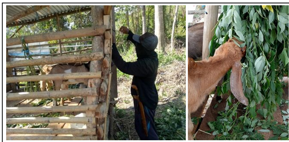
Gambar 6. Pemberian pakan pada ternak kambing.