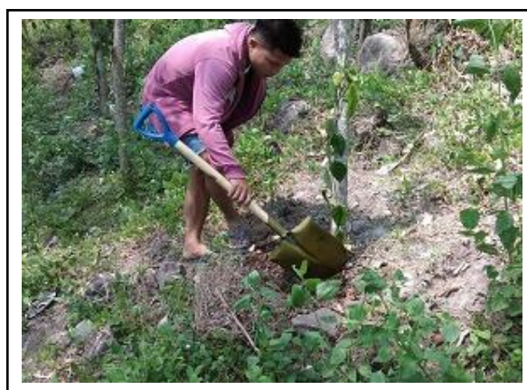
Gambar 5. Pemberian kompos pada tanaman lada.

untuk tetap menjaga keselarasan dengan sistem alami, dengan memanfaatkan dan mengembangkan semaksimal mungkin proses-proses alami dalam pengelolaan usaha tani. Lebih lanjut Harsani dan Suherman (2017) mengemukakan bahwa keberadaan tanaman gamal sebagai pohon penabung memberikan dampak pada ketersediaan hara.