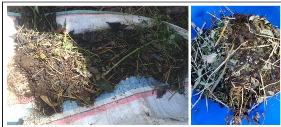
Gambar 3. Proses pengomposan limbah ternak dan pakan.