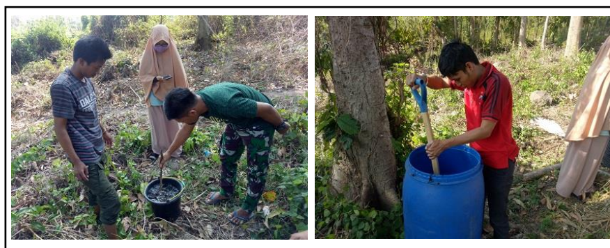
Gambar 4. Proses pembuatan kompos.

Penerapan sistem integrasi tanaman ternak setelah melakukan pengukuran langsung dilapangan diperoleh hasil yang cukup menjanjikan. Potensi kompos yang dapat dihasilkan oleh petani Mitra dari limbah feces ternak dan sisa pakan ternak sebanyak 2,5 kg setiap 2 ekor kambing sehingga dalam setahun petani Mitra dapat menghasilkan 912,5 kg kompos. Dengan demikian petani dapat menghemat/menekan penggunaan pupuk kimia. Kariyasa (2017) mengemukakan bahwa penggunaan pupuk kandang (organik) pada sistem integrasi tanaman ternak telah terbukti mampu meningkatkan produktivitas dan pendapatan petani, serta mengurangi biaya produksi. Selain itu petani