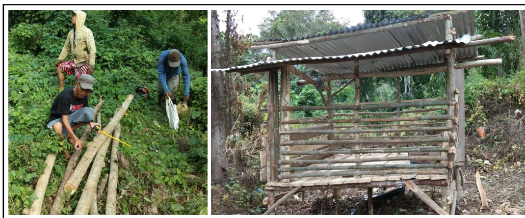
Gambar 2. Proses pembuatan kandang ternak.

petani mitra dimana proses pembuatan model pertanian terintegrasi tanaman ternak ini akan mengintegrasikan antara tanaman lada, gamal dan ternak kambing. Proses kegiatan diawali dengan pembuatan kandang ternak seperti pada Gambar 2. Proses pembuatan dan penempatan kandang berada di lokasi pertanaman lada.