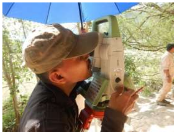
Gambar 2. Pemasangan pesawat TS di pelataran Leang Lambatorang. Sumber BPK XIX 2021

Pelaksanaan pengukuran dan perekaman data gambar di Leang Lambatorang ini dilakukan selama 2 hari, yaitu tanggal 31 Agustus hingga 1 September 2021. Pengukuran lukisan sepenuhnya direkam satu persatu dengan menggunakan instrumen TS (totalstation). Terdapat patok DP yang terpasang permanen dalam lingkungan situs gua menjadi acuan koordinat gua. Dari titik DP inilah kemudian ditransfer ke beberapa DP_BS gua untuk menjangkau dan merekam gambar-gambar di celah dinding gua. Output dari pengukuran ini merupakan koordinat x, y dan elevasi (z) dari setiap lukisan gua yang telah diidentifikasi/telah diberi label.