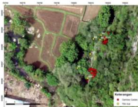
Gambar 1. Peta Keletakan Titik Ikat dan Gambar gua Leang Lambatorang

penduduk. Pelataran gua terbagi menjadi dua bagian dengan bagian dasar berupa lantai tanah dan terap atas merupakan lantai batu. Ukuran gua cukup besar dengan lebar mencapai sekitar 30 meter, sedangkan kedalaman ceruk dari ujung batu luar kedalam sekitar 10 meter. Terdapat 74 gambar cadas dengan rincian 64 cap tangan dan 10 bermotif geometris.