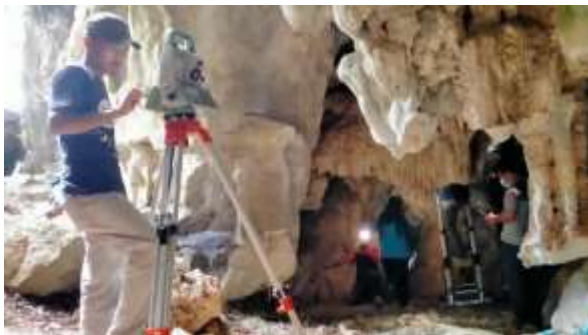
Gambar 3. Proses perpindahan pesawat dari DP ke dalam Leang Lambatorang 2

Adapun gambar tersendiri nomor 34 terletak pada langit-langit di celah sempit di atas bongkahan panel kedua. Kemudian posisi gambar-gambar lainnya yakni di sisi kiri gua pada media dinding yang miring hingga menyentuh bagian dasar bukit karst. Kelihatan sangat banyak pigmen merah dan hitam bercampur pada media ini, bahkan bercampur dengan gambar vandalisme baru yang sulit dikenali. Kondisi media gambar yang menghadap ke arah barat sehingga terpapar cahaya matahari secara langsung mulai siang hingga sore hari. Gambar cap tangan bercampur dengan gambar lainnya baik geometris maupun pigmen bekas gambar sehingga tidak diketahui jenis gambarnya.