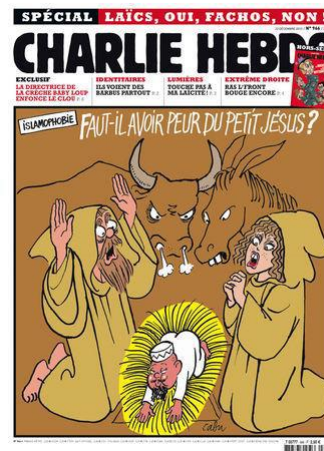
Gambar 3. Islamophobie: faut-il avoir peur du petit Jésus?

Dalam gambar sampul ini warna yang mendominasi adalah warna coklat dan dilatari di bagian atas dengan kalimat: Islamophobie, faut-il avoir peur du petit Jésus? (terjemahan: Islamofobia, Haruskah kita takut pada bayi Yesus?).