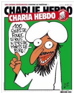
Gambar 8. Charia Hebdo

Sampul terbitan kali ini didominasi warna latar hijau, tulisan Charia Hebdo (Mingguan Syariah) di bagian atas, dan gambar tokoh memakai baju putih, berjanggut, dan memakai sorban putih. Tokoh ini berkata: “100 coups de fouet si vous n’êtes pas morts de rire” (Dihukum 100 cambukan bila anda tidak tertawa terpingkal-pingkal!). Tokoh serupa telah muncul beberapa kali dalam sampul terbitan sebelumnya dan seringkali digambarkan sebagai Nabi Muhammad SAW. Tokoh yang mirip Nabi Muhammad SAW dalam terbitan ini tampak tersenyum lebar dengan mata bulat dan mengacungkan jari telunjuk kanannya seperti sedang memberi peringatan pada para pembaca.