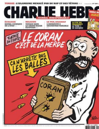
Gambar 12. Tuerie en Egypte, Le Coran c'est de la merde...

Sebagai respon dari serangkaian peristiwa yang menewaskan banyak orang di Mesir pada bulan Juli 2013, Charlie Hebdo no. 1099 edisi 10 Juli 2013 menerbitkan gambar sampul muka berjudul Tuerie en Egypte, le Coran c'est la merde (Pembunuhan di Mesir, Al Quran sama dengan kotoran). Gambar sampul didominasi oleh warna merah. Terlihat gambar karikatural yang merujuk pada seorang muslim berjanggut hitam dengan jubah dan sorban putih yang berada beberapa inci di atas kepalanya untuk memperlihatkan ekspresi terkejut atau marah. Ia memegang Al-Quran yang tampak ditembusi oleh dua butir peluru, sementara beberapa peluru lain mengarah kepadanya, dan sebuah peluru melukai tubuhnya. Kalimat yang diucapkan oleh laki-laki itu adalah “Ça n'arrête pas les balles” (Ini tidak dapat menahan peluru).