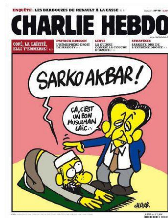
Gambar 4. Sarko akbar!

Terdapat dua tokoh dalam gambar sampul di atas, seorang yang sedang bersujud dan seorang lagi di sampingnya berdiri dengan tangan di atas kepala tokoh lainnya memberikan restunya.