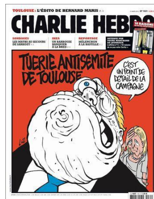
Gambar 10. Tuerie antisémite de Toulouse .

Sampul Charlie Hebdo no 1031 edisi 21 Maret 2012 memperlihatkan karikatur seorang laki-laki pirang dan bola mata berwarna biru dengan kepala menengadah mengucapkan kalimat “ C’est un point de détail de la campagne ” (Ini adalah butir rincian dari kampanye beliau). Formulasi kalimat yang serupa pernah diucapkan oleh Jean-Marie Le Pen, Pemimpin Partai Front National di Prancis yang berideologi ekstrem kanan. Le Pen pada tahun 1987 memberikan pendapat tentang kamar gas yang digunakan oleh tentara Nazi untuk menghabiskan kaum Yahudi dan mengatakan, “Saya tidak secara khusus mempelajari