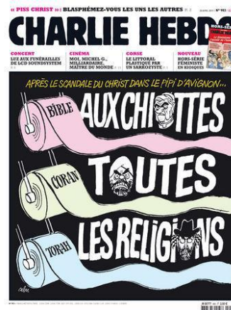
Gambar 5. Après le scandale du Christ dans le pipi d'Avignon

Dalam sampul ini terdapat satu kalimat yang panjang yaitu: Après le scandale du Christ dans le pipi d'Avignon... Aux chiottes toutes les religions (terjemahan: Setelah skandal Yesus di Avignon... Persetan dengan semua agama).