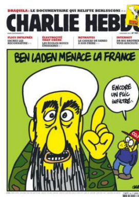
Gambar 2. Ben Laden menace la France

Kalimat utama dalam gambar sampul ini diletakkan di bagian paling atas dan berbunyi: Ben Laden menace la France