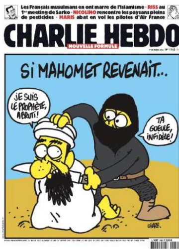
Gambar 15. Si Mahomet revenait

Charlie Hebdo no 1163 edisi 1 Oktober 2014 memuat sampul muka dengan judul Si Mohamet revenait ... (terjemahan: Jika Muhammad kembali...). Nabi Muhammad digambarkan secara karikatural sebagai seorang laki-laki berjubah putih