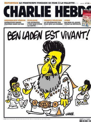
Gambar 6. Ben Laden est vivant!

Kalimat utama ditulis di bagian atas berbunyi Ben Laden est vivant! (terjemahan: Ben Laden masih hidup!). Terdapat tiga tokoh yang digambarkan memakai pakaian khas yang sering dipakai oleh Elvis Presley yaitu setelah putih dengan belahan dada rendah, kerah yang tinggi, sabuk tebal dengan banyak ornamen, celana putih dan sepatu putih. Tokoh yang paling depan digambarkan paling besar dengan wajah menghadap ke pembaca. Rambut bagian depan disisir tinggi seperti Elvis Presley tapi ia memiliki janggut panjang seperti yang dimiliki oleh lelaki Arab pada umumnya. Tangan sebelah kanan berpangku di pinggang.