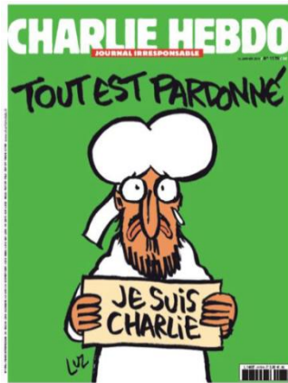
Gambar 16. Tout est pardonné, Je suis Charlie

Dalam gambar sampul ini terdapat kalimat yang diletakkan di bagian atas sampul berbunyi: Tout est pardonné (terjemahan: Semua telah diampuni). Kalimat lain adalah: Je suis Charlie (terjemahan: Aku Charlie) yang ditulis dalam kertas yang dipegang oleh tokoh karikatural yang digambarkan mirip dengan Nabi Muhammad SAW. Meskipun agama Islam tidak pernah menampilkan gambar Nabi Muhammad, mingguan Charlie Hebdo kerap menampilkan tokoh yang dengan jelas merepresentasikan Nabi Muhammad. Tokoh karikatural Nabi Muhammad digambarkan dengan mata terbelalak, meneteskan air mata, dan dengan bibir tertekuk ke bawah. Tokoh berada di tengah dengan latar belakang berwarna hijau dengan pakaian berwarna putih. Kedua warna tersebut sering diasosiasikan dengan Islam.