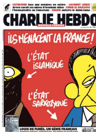
Gambar 14. Ils menacent la France

Charlie Hebdo edisi 24 September 2014 memuat gambar karikatur mantan Presiden Prancis, Nicolas Sarkozy, dengan seseorang dari garis keras Islam, yang terlihat dari pakaian yang dikenakannya. Di bagian atas tertulis "Ils menacent la France!" (terjemahan: Mereka mengancam Prancis!). Tanda panah pertama yang mengarah ke kiri merujuk pada seseorang yang tampak separuh muka dan sebagian tubuhnya yang menggunakan pakaian dan penutup wajah serba hitam seperti yang biasa dipakai oleh penganut Islam radikal. Tepat di atas anak panah tersebut tertulis L'ÉTAT ISLAMIQUE atau Negara Islam. Tanda panah kedua di bagian bawah gambar tepat berada di bawah tulisan L'ÉTAT SARKOZIQUE atau Negara Sarkozy.