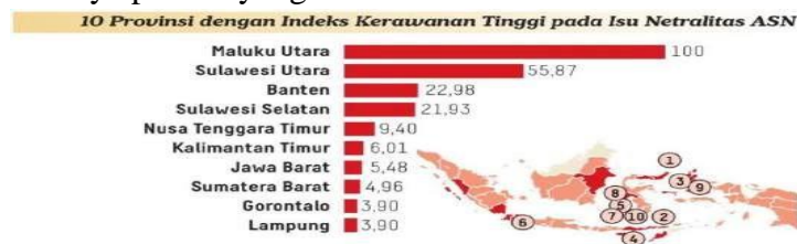
Gambar 1. Provinsi dengan indeks kerawanan tinggi pada isu netralitas ASN. 7

Politik praktis membuat kasus ketidaknetralan pada ASN selalu terjadi dalam setiap pemilihan seperti pada Pemilu 2019 terdapat 990 kasus dan pada tahun 2020 terdapat 727 kasus. 4 Isu netralitas ini kembali terjadi pula pada Pemilu 2024 dengan total 197 ASN yang terbukti melanggar dan mendapat rekomendasi penjatuhan sanksi oleh Komisi Aparatur Sipil Negara (KASN). 5 Kondisi demikian, menyebabkan tidak efektifnya penyelenggaraan pemilu yang bebas dan berkeadilan yang sebagaimana indikator terlaksananya pemilu yang berkualitas. 6