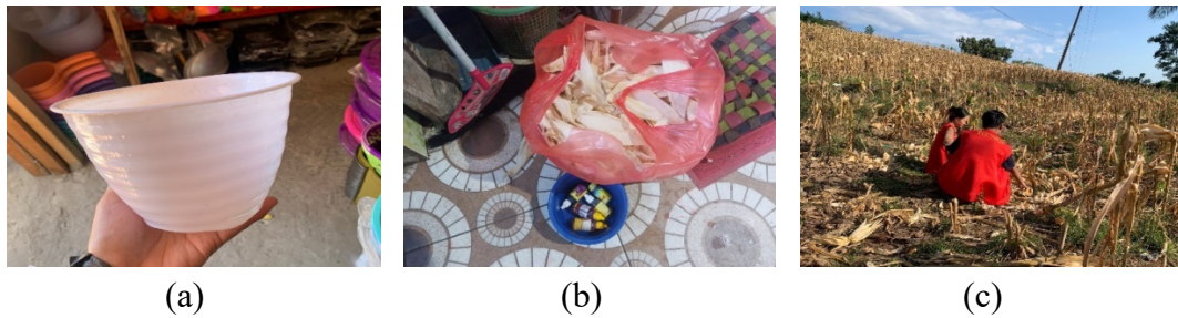
Gambar 2. Persiapan alat dan bahan (a) pot (b) kulit jagung dan pewarna makanan (c) pengambilan kulit jagung di kebun