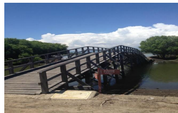
Gambar 2. Pemandangan yang menarik