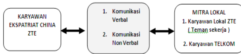
Gambar.1 : Pola Perilaku komunikasi karyawan ekspatriat China dan mitra lokal