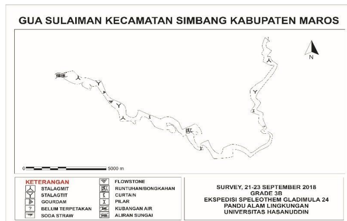
Gambar 3. Hasil Pemetaan Gua Sulaiman

Jarak total dari entrance gua sampai dengan ujung gua ialah \pm 320,52 meter, dengan jumlah stasiun pemetaan gua sebanyak 67 stasiun yang merupakan lorong utama dan lima lorong cabang. Gua Sulaiman memiliki 2 jenis lorong berdasarkan aliran airnya, yaitu lorong fosil yang ditemukan di