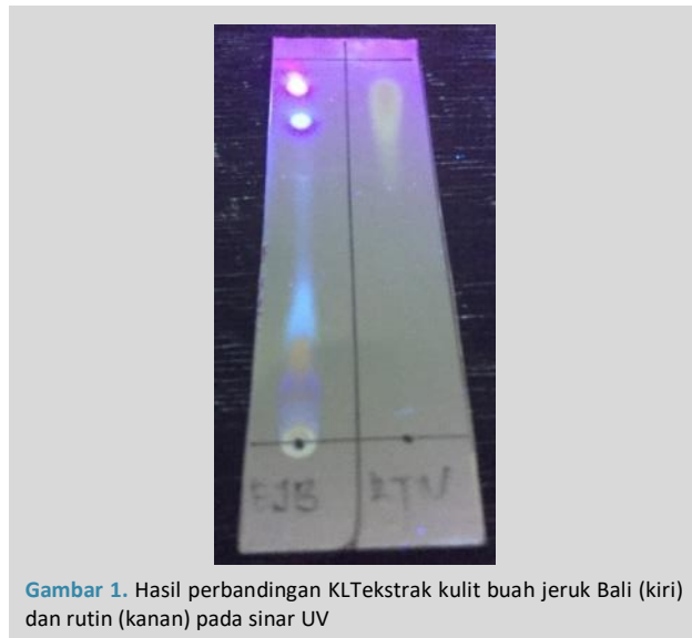
Gambar 1. Hasil perbandingan KLT ekstrak kulit buah jeruk Bali (kiri) dan rutin (kanan) pada sinar UV

Pada analisis KLT, komponen kimia bergerak naik mengikuti fase gerak karena daya serap adsorben terhadap komponen-komponen kimia tidak sama sehingga komponen kimia dapat bergerak dengan jarak yang berbeda berdasarkan tingkat kepolarannya. Hal inilah yang menyebabkan terjadinya pemisahan komponen-komponen kimia di dalam ekstrak (22)