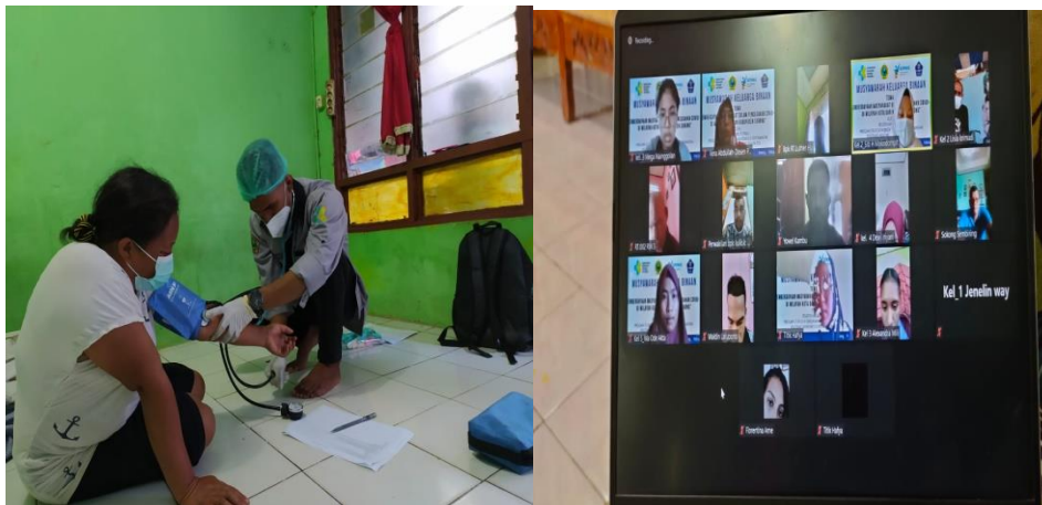
Gambar 3. Pengkajian Data (Luring) dan MMD (Daring)

Pada kegiatan pendataan ini, masing-masing mahasiswa mendata di sekitar tempat tinggalnya sebanyak 4 KK. Informasi yang didata terkait usia, status kesehatan serta pengetahuan terkait Covid-19. Selain menggali data secara subjektif mahasiswa juga menggali data objektif dengan melakukan pemeriksaan secara langsung terkait TB, BB, IMT dan tanda-tanda vital. Lebih jelas dapat dilihat pada gambar 3 dibawah ini: