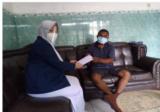
Gambar 2. Menyerahkan surat izin KKL ke Ketua RT (Luring)

Tahap Pelaksanaan dilakukan selama 11 hari yang terdiri dari kegiatan Pendataan Keluarga selama 4 hari kemudian melanjutkan dengan identifikasi masalah, serta tahap pelaksanaan program KKL selama 7 hari yang dilanjutkan dengan evaluasi hasil program yang telah dilaksanakan. Namun sebelum kegiatan dimulai mahasiswa wajib bertemu ketua RT untuk meminta izin. Lebih jelasnya dapat di lihat pada gambar 2 dibawah ini: