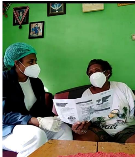
Gambar 4 . Edukasi Covid 19

Hasil temuan kasus dilakukan intervensi berdasarkan masalah yang ditemukan pada kelompok keluarga binaan, dapat menggunakan tekni penyuluhan maupu demonstrasi secara langsung yang berhubungan dengan covid-19. Lebih jelas dapat dilihat pada gambar 4 dibawah ini: