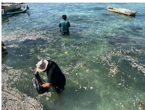
c. Sampah Batu Apung