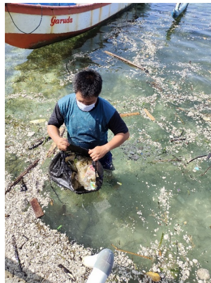
b. Sampah di perairan