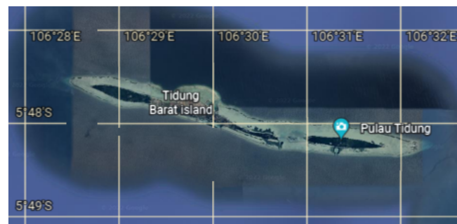
Gambar 1. Pulau Tidung, Kepulauan Seribu Selatan, DKI Jakarta

Tempat dan Waktu. Kegiatan Pengabdian Pada Masyarakat ini dilakukan di Pulau Tidung, Kepulauan Seribu Selatan, DKI Jakarta (Gambar 1), pada tanggal 25-27 Maret 2022.