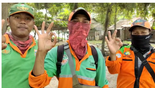
Gambar 7. Petugas Sampah Pesisir dengan slogan “NOL SAMPAH

Petugas Penanganan Prasarana dan Sarana Umum (PPSU) di Pulau Tidung Besar bekerja untuk mengumpulkan sampah yang bukan merupakan sampah pesisir (Gambar 8). Sampah-sampah ini merupakan sampah rumah tangga. Sampah ini sudah terkumpul di tempat sampah dan tinggal petugas PPSU yang mengambilnya. Putra (2015) mengatakan bahwa pada tahun 2016 pemerintah menyediakan tempat sampah lebih banyak, melakukan penanganan sampah dan limbah dengan lebih baik dan juga penambahan petugas kebersihan umum atau biasanya disebut dengan pasukan orange. Strategi pengelolaan sampah yang paling baik yang dapat diterapkan di Pulau Tidung adalah dengan cara mendaur ulang sampah plastik menjadi bijih plastik dan membuat bahan dasar kompos dari sampah organik.