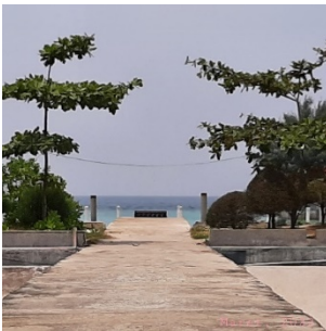
c. Dermaga P. Tidung Kecil