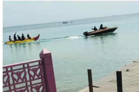
b. Banana Boat