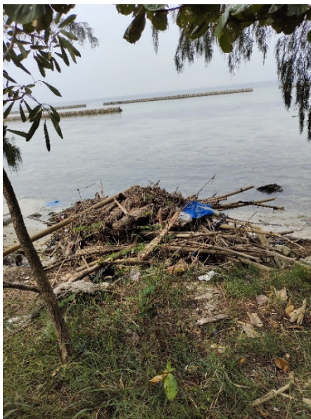
a. Sampah di yang terdampar di pantai

Berdasarkan pengamatan di lapangan dan wawancara dengan ketua kelompok petugas sampah pesisir (Bapak Dimiyati) disampaikan bahwa sumber sampah berasal dari dalam pulau maupun luar pulau. Sampah yang berasal dari dalam pulau didominasi oleh sampah buangan rumah tangga, sedang sampah yang berasal dari luar pulau adalah sampah-sampah yang terbawa oleh arus yang masuk dan terdampar di pantai (Gambar 5). Sahwan (2004) menyampaikan bahwa sampah-sampah yang terbawa oleh arus sangat dipengaruhi oleh musim. Penelitian tentang keberadaan sampah di Pulau Seribu sudah sejak tahun 1985. Rositasari (2017) menyatakan bahwa penelitian di Kepulauan Seribu mulai dilakukan pada 1970-2015. Sunyowati et al. (2022) menyatakan ancaman sampah plastik di kawasan pesisir pantai berasal dari sampah darat ( land-based ) dan sampah yang berasal dari laut ( pasang-surut ).