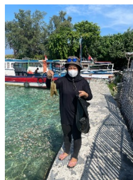
d. Sampah kesehatan (Masker)