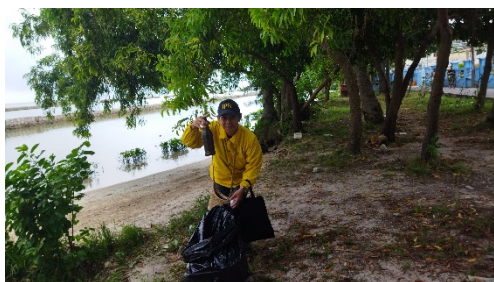
a. Sampah Botol