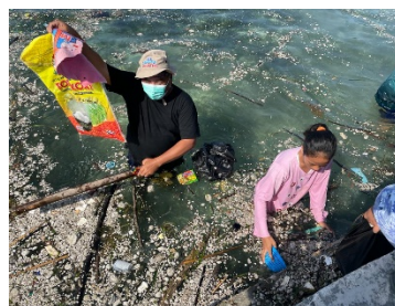
b. Sampah karung beras