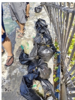
Gambar 3. Contoh Sampah yang terkumpul

Berdasarkan hasil sampah-sampah yang terkumpul dari perairan maupun di daratan ditemukan berbagai jenis sampah. Sampah-sampah ini ada yang mengambang di perairan maupun ada di dasar perairan, atau yang dibuang berserakahan di tepi pantai. Jenis sampah yang ditemukan di air di antaranya (Gambar 4).