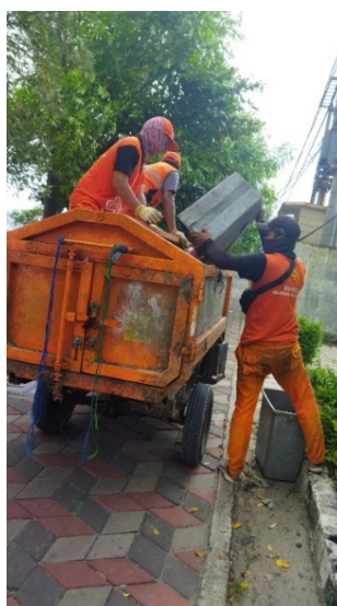
Gambar 8. Petugas Prasarana dan Sarana Umum (PPSU)

Petugas Penanganan Prasarana dan Sarana Umum (PPSU) di Pulau Tidung Besar bekerja untuk mengumpulkan sampah yang bukan merupakan sampah pesisir (Gambar 8). Sampah-sampah ini merupakan sampah rumah tangga. Sampah ini sudah terkumpul di tempat sampah dan tinggal petugas PPSU yang mengambilnya. Putra (2015) mengatakan bahwa pada tahun 2016 pemerintah menyediakan tempat sampah lebih banyak, melakukan penanganan sampah dan limbah dengan lebih baik dan juga penambahan petugas kebersihan umum atau biasanya disebut dengan pasukan orange. Strategi pengelolaan sampah yang paling baik yang dapat diterapkan di Pulau Tidung adalah dengan cara mendaur ulang sampah plastik menjadi bijih plastik dan membuat bahan dasar kompos dari sampah organik.