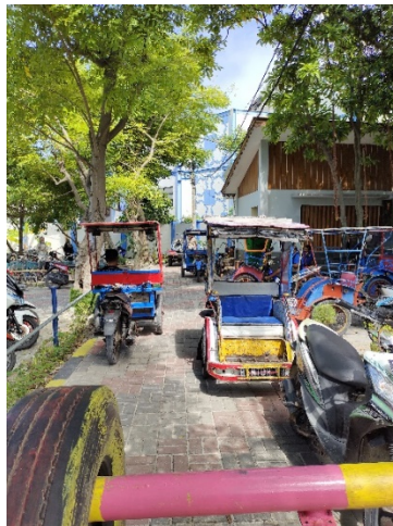
e. Alat transportasi (Becak Motor)