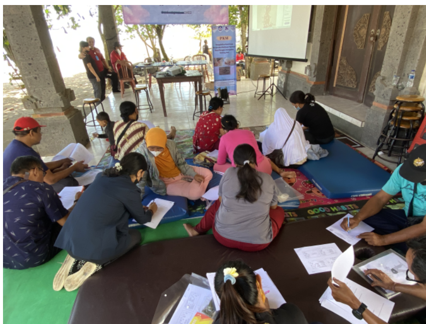
Gambar 1. kegiatan pretest

Dari hasil pretest dan posttest didapatkan bahwa terjadi peningkatan pemahaman mitra terkait dengan konsep dasar pengolahan tanaman herbal menjadi minuman dari nilai rerata pretest sebesar 30 menjadi nilai rerata posttest sebesar 85. Berdasarkan hasil tersebut menunjukkan bahwa penyuluhan yang diberikan memberikan dampak yang sangat besar terkait dengan peningkatan pemahaman mitra.