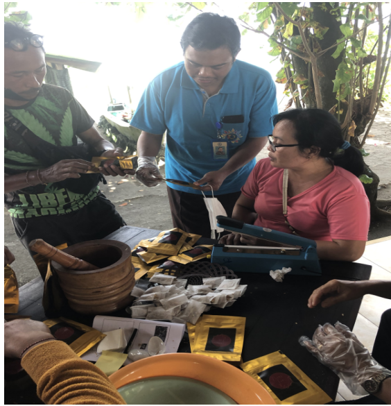
Gambar 4. Praktik Pengemasan

Dalam kegiatan PKM ini, tim pelaksana mengajarkan cara mengemas produk dengan baik sehingga dihasilkan produk yang menarik.