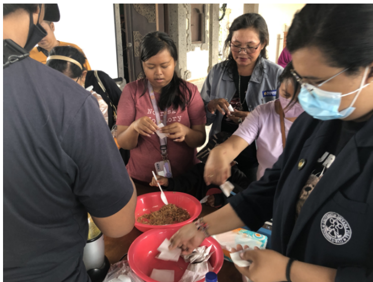
Gambar 3. Praktek Pembuatan Minuman Herbal

Pada kegiatan pelatihan pembuatan minuman herbal, peserta dibagi menjadi 2 kelompok yang terdiri dari masing-masing berjumlah 5 orang anggota dan dibantu oleh beberapa mahasiswa yang berperan sebagai instruktur. Tugas instruktur dalam kegiatan ini adalah mendampingi masing-masing kelompok dalam mempraktekkan pembuatan minuman herbal.