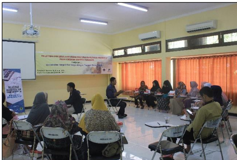
Gambar 3. Pendampingan pengelolaan usaha dan keuangan sederhana

Harapan kegiatan ini adalah para mustahiq dapat mengelola zakat yang diperoleh dengan prinsip pengelolaan keuangan sederhana tersebut. Ketika mereka mendapatkan zakat dapat dibagi menjadi tiga bagian yaitu untuk modal, tabungan dan konsumsi. Manakala mereka dapat mengelompokkan uang zakat tersebut harapannya mereka memiliki motivasi lebih untuk memiliki usaha dan mengembangkannya.