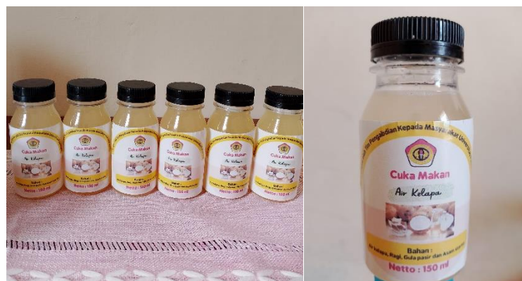
Gambar 4. Pengemasan Produk Cuka Makan