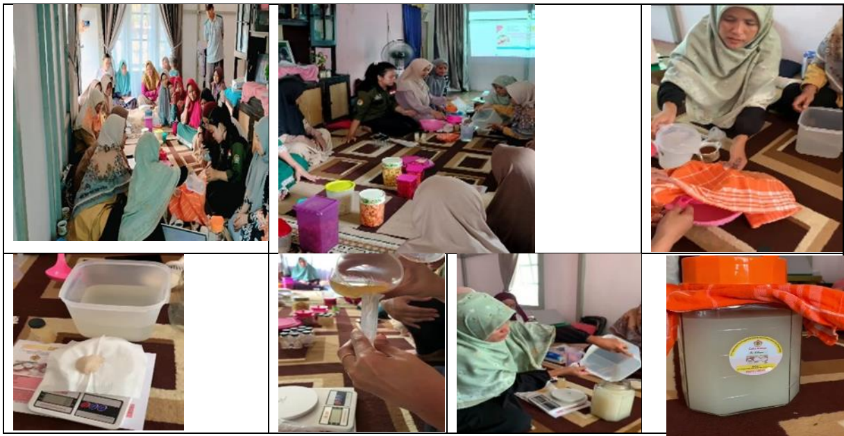
Gambar 3. Proses Pengolahan Cuka Makan Air Kelapa

produk, tetapi juga secara nyata meningkatkan nilai ekonomi, keberlanjutan, dan daya tarik pasar cuka (Febri & Wiwin, 2021).