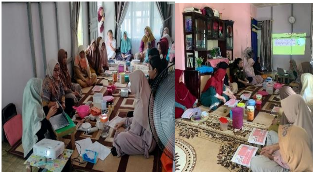
Gambar 2. Penyuluhan Dampak dan Pemanfaatan Limbah Air Kelapa Di Desa Sungai Rengas

Pemahaman mitra terhadap dampak limbah air kelapa terhadap lingkungan menjadi penting mengingat limbah air kelapa yang selama ini dibuang langsung ke tanah atau sungai tanpa pengolahan, yang berpotensi menimbulkan pencemaran dan masalah kesehatan lingkungan. Air kelapa mengandung senyawa organik dengan kadar Biochemical Oxygen Demand (BOD) dan Chemical Oxygen Demand (COD) yang tinggi, sehingga pembuangannya secara langsung dapat menurunkan kadar oksigen terlarut di perairan, memicu pertumbuhan mikroorganisme patogen, dan menyebabkan bau tidak sedap (Swain dkk., 2014) dan (Kailasapathy & Tamang, 2010). Adanya pengetahuan dan pemahaman yang baik dari peserta mengenai potensi limbah diharapkan mampu mengubah sikap dan perilakunya mereka dalam memanfaatkannya menjadi produk bernilai ekonomi. Pengetahuan yang memadai akan memberikan dasar bagi individu untuk menyadari nilai tambah yang dapat dihasilkan dari limbah, sementara pemahaman yang baik akan membantu dalam mengidentifikasi peluang pengolahan dan pemasaran produk tersebut (Aiman dkk., 2025).