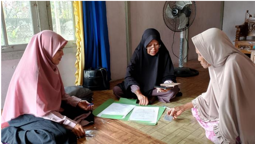
Gambar 1. Dokumentasi Kesiadaan Mitra Di Desa Sungai Rengas