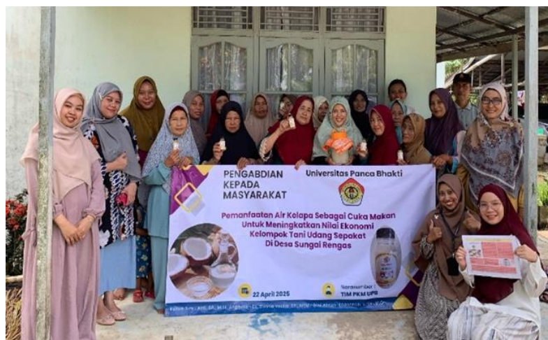
Gambar 6. Tim Pelaksana dan Peserta Kegiatan

Adanya pengetahuan dan persepsi yang baik dari peserta mengenai produk cuka makan menjadi potensi bahwa pengolahan air kelapa menjadi cuka makan akan menjadi alternatif bagi masyarakat dalam memanfaatkan limbah air kelapa juga menjadi peluang melakukan diversifikasi produk. Hal ini berdasarkan keinginan peserta untuk mendapatkan pengetahuan tambahan melalui diskusi sederhana setelah beberapa waktu kegiatan pengabdian dilaksanakan yang mengindikasikan akan adanya partisipasi dari peserta dalam mengurangi limbah air kelapa. Pengetahuan, persepsi dan partisipasi merupakan komponen penting bagi petani dalam merealisasikan pengolahan limbah tani menjadi suatu yang bernilai (Asti dkk., 2024). Pengetahuan dan persepsi yang baik akan mendorong timbulnya keinginan seseorang untuk ikut serta dalam melakukan sesuatu termasuk dalam pemanfaatan limbah (Pitri; dkk., 2023). Perubahan berfikir dalam memandang limbah pertanian menjadi perlu salah satunya dengan memahaminya sebagai produk olahan yang akan menjadi hasil sampingan. Limbah pertanian dapat berpotensi memiliki nilai ekonomis jika dilakukan pengelolaan dengan baik menjadi suatu produk olahan sehingga memberikan nilai tambah, menjadi salah satu makanan sehat dan selanjutnya dapat membuka lapangan kerja baru sekaligus sebagai upaya menjaga kelestarian lingkungan (Ajrin dkk., 2023)