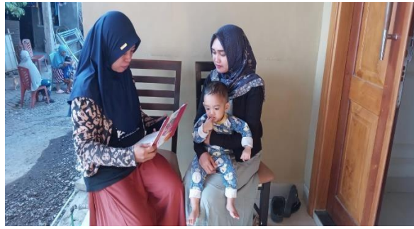
Gambar 3. Kegiatan Posyandu Tinggito