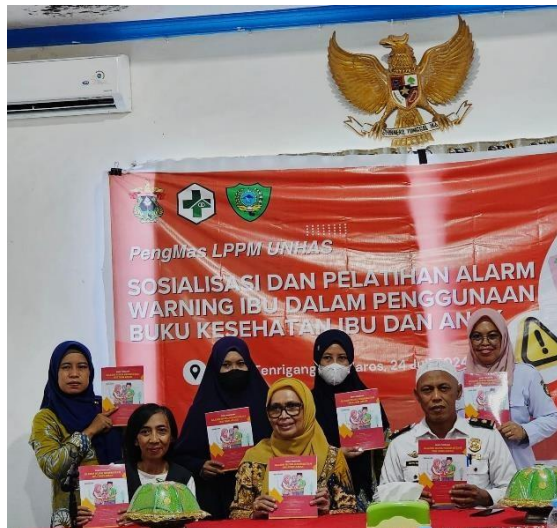
Gambar 2. Sosialisasi dan Pelatihan

Pada saat pelatihan setiap kader dari Posyandu intervensi dibagikan buku panduan kemudian dijelaskan bagaimana cara menggunakan buku tersebut. Harapannya buku ini dapat mengingatkan apa saja yang harus dinilai pada anak berdasarkan usianya.