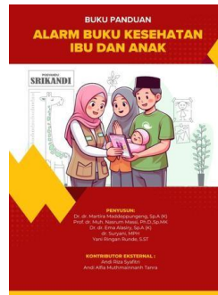
Gambar 1. Buku Panduan Alarm Buku KIA