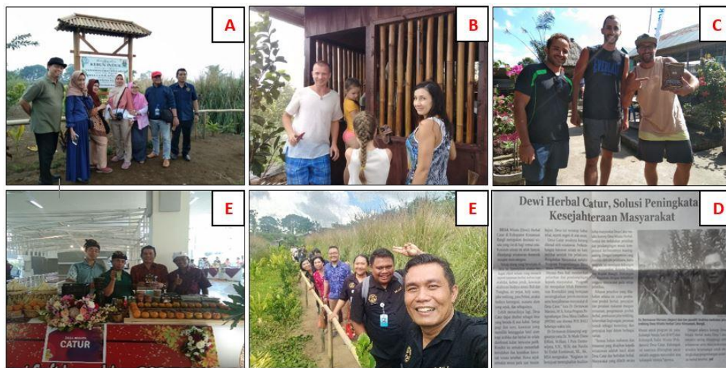
Gambar 5. Dokumentasi kegiatan yang dilakukan oleh Pokdarwis dan KWT di Desa Catur, Kintamani, Bali dalam mempromosikan desanya: A) peserta rakornas HKI Kementerian Ristekdikti berwisata di kebun induk herbal; B) wisatawan mancanegara mengedukasi anaknya tentang manfaat herbal; C) wisatawan mancanegara mempromosikan kopi dan Desa Catur; D) mengikuti pameran Go Destination Village ; E) wisatawan melakukan trekking di kebun kopi, jeruk, dan herbal; dan F) promosi di media cetak koran Pos Bali berjudul Dewi Herbal Catur .

Metode dan langkah-langkah pemasaran destinasi wisata herbal di Desa Catur yang dilakukan oleh anggota Pokdarwis dan KWT selama ini sebagaimana ditunjukkan pada Gambar 5 berikut ini.