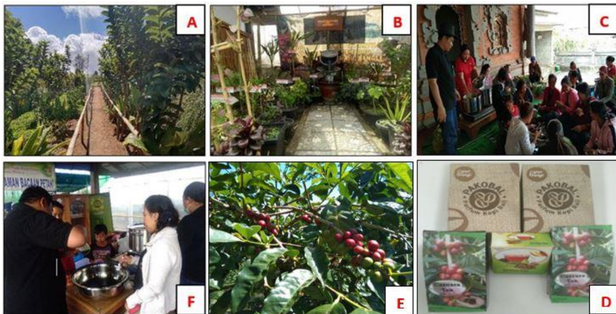
Gambar 2. Dokumentasi kegiatan yang dilakukan oleh KWT di Desa Catur, Kintamani, Bali: A) kebun induk tempat budidaya tanaman herbal; B) budidaya tanaman herbal di halaman rumah; C) pelatihan pengenalan jenis dan manfaat tanaman herbal; D) produk herbal yang sudah dikemas yaitu teh cerry kopi, teh daun kopi, dan parfum kopi; E) pembudidayaan kopi arabika yang termasuk tanaman herbal; dan F) proses pembuatan produk herbal.

Proses pengembangan tanaman herbal dilakukan dengan 3 tahap yaitu pelatihan, pendampingan, dan pemasaran. Tanaman herbal yang sudah siap dipanen yang diambil dari kebun induk maupun halaman rumah masyarakat, kemudian diolah menjadi produk herbal yaitu teh cerry kopi (cascara), teh daun kopi, dan parfum kopi. Proses pengembangan tanaman herbal dan pembuatan produk herbal di Desa Catur sebagaimana terlihat pada Gambar 2 berikut ini.