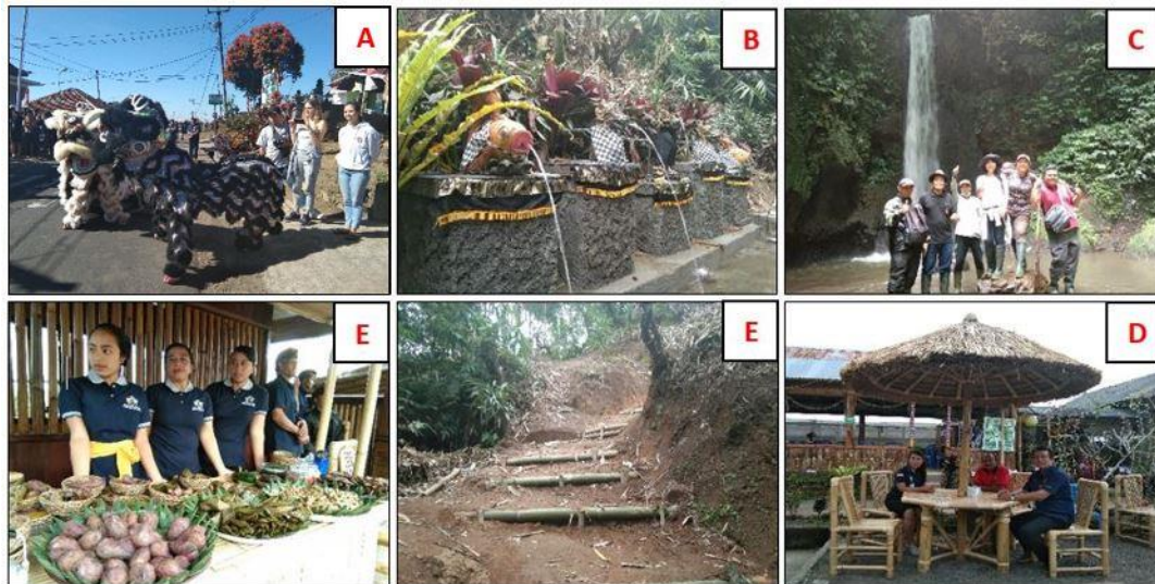
Gambar 4. Dokumentasi kegiatan yang dilakukan oleh Pokdarwis di Desa Catur, Kintamani, Bali: A) atraksi barongsai wujud akulturasi budaya Bali dan Tionghoa disaksikan oleh wisatawan; B) panataan objek wisata mata air suci ( holy water ); C) penataan air terjun Tiyang Seni; D) pembuatan gazebo bagi wisatawan; E) pembuatan jalur trekking di kebun kopi dan jeruk; dan F) pelatihan penyajian makanan dan minuman tradisional.

PPDM membuahkkan hasil yang sangat membanggakan. Desa Wisata Herbal Catur diutus oleh pemerintah daerah untuk mewakili Kabupaten Bangli mengikuti lomba Tanaman Obat Keluarga (Toga) se-Provinsi Bali dan meraih juara 3. Kesuksesan ini terus berlanjut pada tanggal 10 Juni 2019 mengikuti lomba desa wisata se-Provinsi Bali yang diselenggarakan oleh Kementerian Pariwisata dan Kementerian Desa dan berhasil meraih juara 2. Kemudian tanggal 30 – 31 Agustus 2019 Desa Catur menjadi juara 3 dalam mengikuti event launching Go Destination Village (GODEVI) dan Pameran Desa Wisata yang diselenggarakan oleh Dinas Pariwisata Provinsi Bali yang bekerja sama dengan Kementerian Desa.