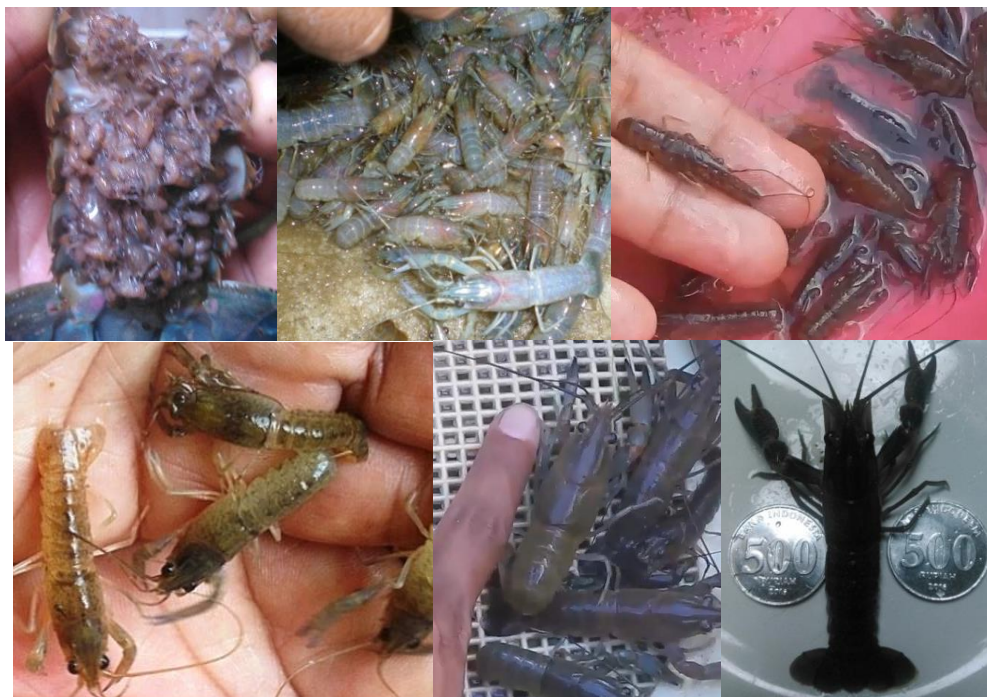
Gambar 6. Sampel benih/anakan LAT yang berhasil diproduksi mitra