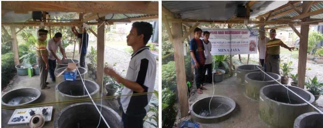
Gambar 3. Unit pembenihan lobster air tawar yang dikelola oleh mitra

Kolam yang dimiliki mitra direhabilitasi atau dikonstruksi ulang untuk kolam pemeliharaan indukan, indukan bertelur, dan kolam pemeliharaan benih dilaksanakan masing-masing kelompok. Indukan lobster air tawar (induk jantan dan betina) didatangkan dari penyuplai induk yang berkualitas. Indukan tersebut dibawa ke lokasi mitra. Indukan lobster yang diberikan kepada kedua mitra berukuran 100-150 g/ekor. Penyerahan indukan dilakukan 3 tahap, jumlahnya sebanyak 45 ekor atau 5 set (1 set terdiri dari 3 betina dan 2 jantan). Sarana produksi tersebut merupakan modal utama yang memadai bagi setiap kelompok untuk mengembangkann pembenihan LAT (Gambar 4).