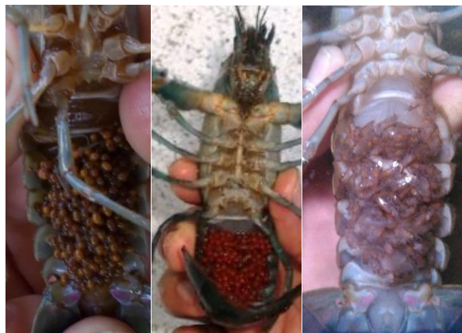
Gambar 5. Indukan lobster air tawar mengerami telur dan menggendong larva

Benih LAT yang diproduksi umumnya dipelihara sendiri untuk dibesarkan sampai ukuran konsumsi atau sebagai indukan dan sebagian dijual pada ukuran benih. Setelah memasuki tahun kedua, mitra dapat memproduksi LAT dalam bentuk benih, ukuran konsumsi bahkan indukan LAT.