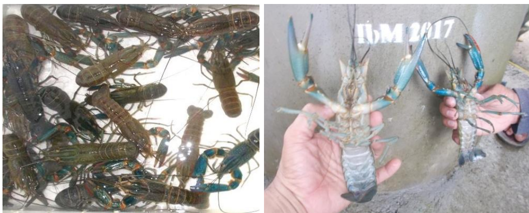
Gambar 4. Introduksi indukan lobster air tawar Cerax quadricarinatus