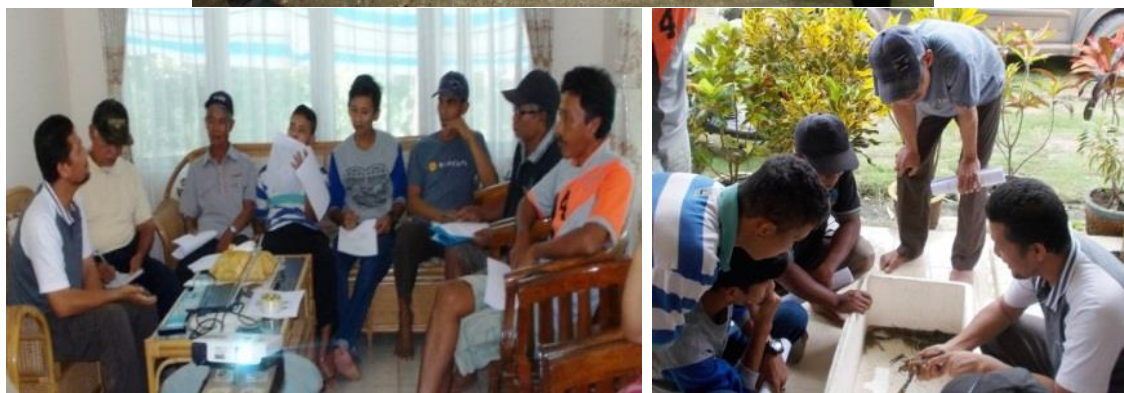
Gambar1. Suasana penyuluhan dan pelatihan pembenihan lobster air tawar