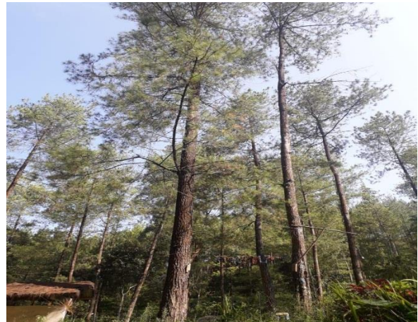
Gambar 2b. Pohon Pinus