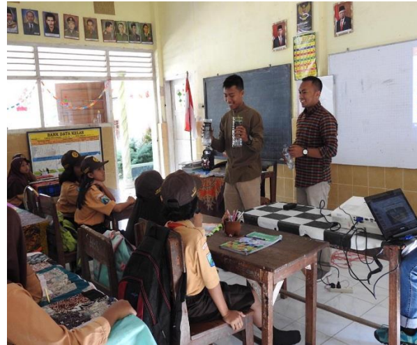
Gambar 1b. Simulasi air masuk ke tanah yang berisi sampah