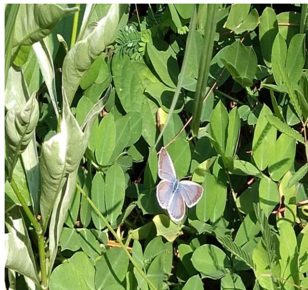
Gambar 2d. Kupu-Kupu

Tabel 2 di atas menunjukkan nilai persentase kenaikan, konstan dan penurunan setelah diberikan kuesioner saat pre test dan post test. Berdasarkan hasil dalam Tabel 1 menunjukkan bahwa mengalami kenaikan pada kelas 4 (53,85%) dan kelas 5 (61,54%), hasil tersebut menggambarkan bahwa Siswa kelas 4 dan 5 mendapatkan pemahaman setelah mendapatkan materi tentang hutan sehingga para Siswa kelas 4 dan 5 bisa memberikan jawaban yang sesuai setelah menyelesaikan post test. Penjelasan menggunakan gambar membuktikan memberikan pemahaman yang lebih cepat dan baik (Oktavianti & Wiyanto, 2014), serta penyampaian saat menjelaskan kepada siswa sekolah dasar dengan cara lembut akan memberikan efek yang baik di dalam kelas. Hasil lainnya adalah penurunan kelas 4 (15,38%) dan kelas 5 (11,54%), hasil tersebut bisa dikarenakan kemampuan siswa yang berbeda-beda dalam menerima informasi (Romansyah & Nurhamdiah, 2018) dan kurangnya fokus atau keraguan.