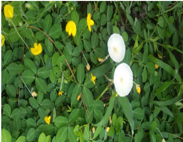
Gambar 2a. Tumbuhan Bawah