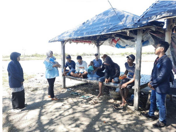
Gambar 2. Kegiatan Sosialisasi Penerapan IPAL Tambak Udang Vaname Tradisional