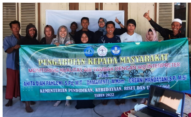
Gambar 4. Kegiatan Pelatihan Aplikasi WQ Interpreter