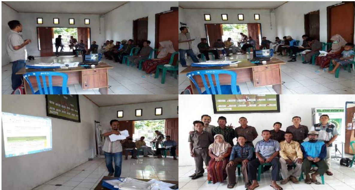
Gambar 2 : Proses fasilitasi

bersinggungan dengan isu akuntabilitas sosial, transparansi, keterlibatan warga, dan keterbukaan informasi publik yang secara khusus diamanatkan oleh UUDesa dan UUKIP. UUDesa mengkonstruksi desa sebagai masyarakat berpemerintahan sendiri ( self-governing community ) yang menganut prinsip demokrasi, di mana masyarakat desa juga diberikan hak untuk ikut serta mengendalikan penyelenggaraan pemerintahan. Penciptaan keterbukaan informasi oleh Pemerintah Desa dimaksudkan agar masyarakat desa dapat mengetahui berbagai informasi tentang kebijakan dan praktek penyelenggaraan pemerintahan.