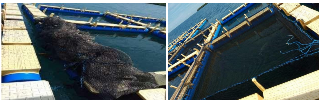
Gambar 2. Survei lokasi mitra

Kunjungan tim pendampingan dilakukan ke lokasi Kelompok yang bertempat di kabupaten Boalemo untuk melihat kondisi lapangan dari lokasi pengabdian serta perkenalan dengan kelompok pembudidaya yang menjadi mitra kegiatan (Gambar 2).