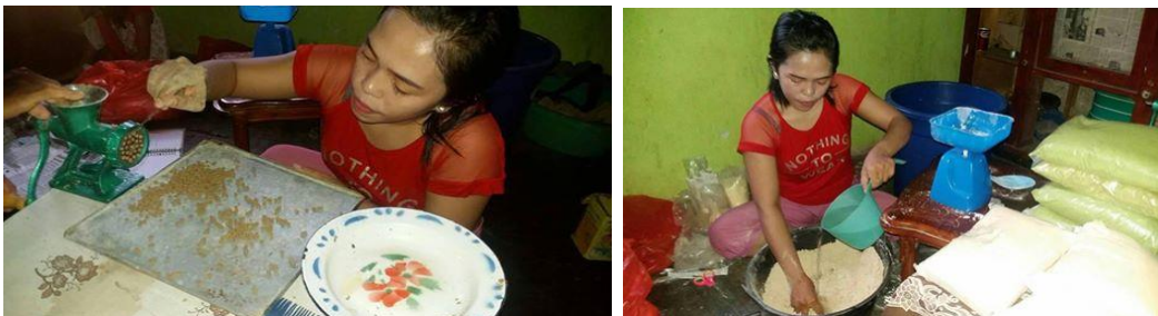
Gambar 6. Kegiatan salah satu kelompok mitra pada saat pembuatan pakan pellet

Kegiatan revitalisasi kegiatan budidaya menggunakan jaring apung di kelompok budidaya dilakukan untuk meningkatkan produktivitas hasil perikanan dan peningkatan ekonomi masyarakat pesisir dalam hal ini kelompok budidaya. Pada peninjauan lokasi awal kegiatan diperoleh gambaran bahwa kegiatan budidaya tidak berjalan dengan semestinya padahal kesesuaian kondisi dan fasilitas untuk budidaya cukup tersedia. Kondisi jaring apung yang pada awalnya tidak terfungsikan kini kembali dimanfaatkan dan sudah menjalankan proses budidaya ikan kerapu. Selain itu masyarakat juga sudah mulai memahami keterampilan pemeliharaan keramba jaring apung agar terhindar dari hama pengganggu, aplikasinya dilakukan dengan pembersihan yang sering dilakukan minimal sebulan sekali pada KJA sehingga sampai dengan sekarang tidak ada indikasi adanya serangan penyakit dan virus untuk budidaya kerapu.