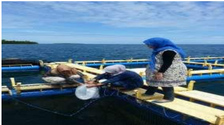
Gambar 3. Penebaran benih kerapu tikus

tentang jenis dan penggunaan vaksin pada ikan kerapu dengan cara yang tepat (Gambar 5).