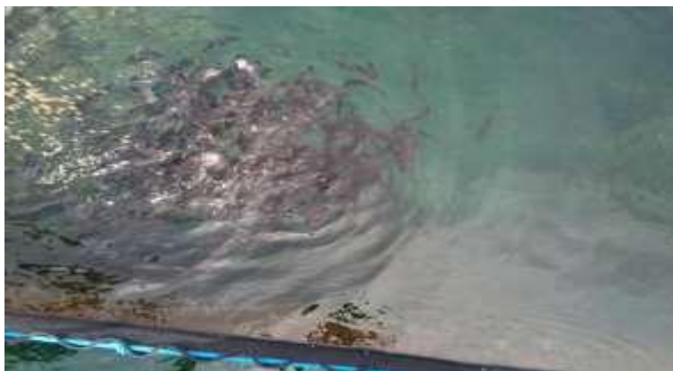
Gambar 4. Benih Kerapu tikus