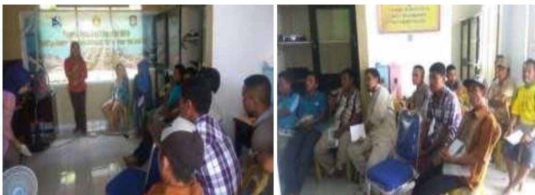
Gambar 5. Penyuluhan pada kelompok Bahtera Lamu dan Lamu Bahari