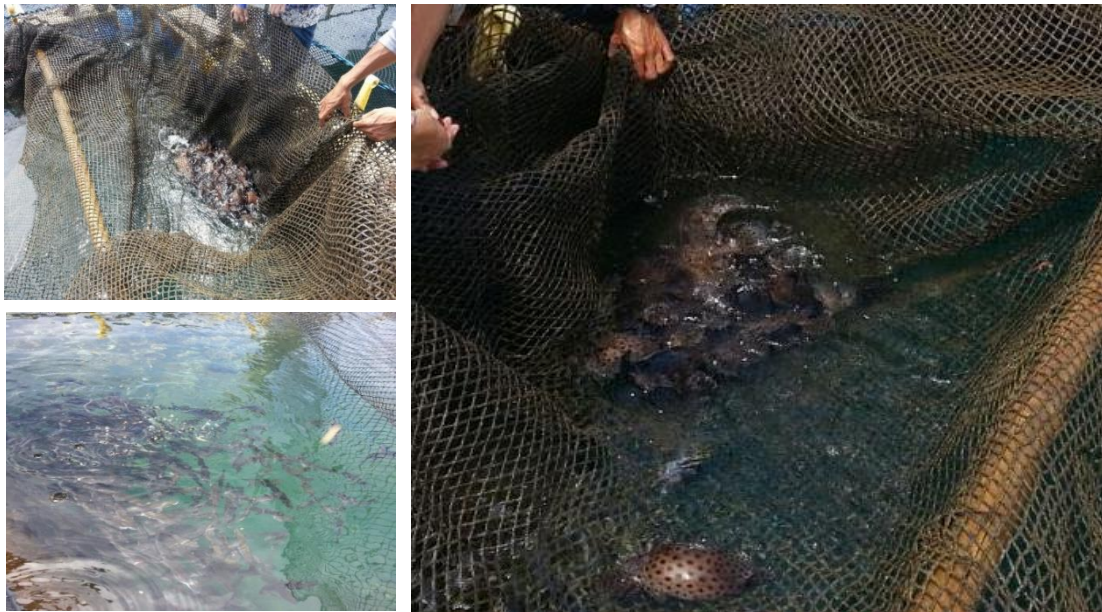
Gambar 7. Monitoring budidaya ikan kerapu tikus pada kelompok mitra

kerapu menyenangi untuk tinggal di dasar jaring sehingga apabila teritip tersebut melengket pada jaring maka teritip akan melukai ikan kerapu tersebut (Gambar 7). Apabila tubuh ikan kerapu luka akan rentan terkena penyakit khususnya penyakit Vibrio .