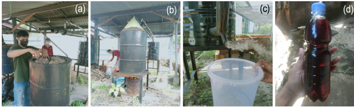
Gambar 2. Pembuatan asap cair: (a) memasukan bahan baku dalam reactor, (b) pirolisis, (c) penampungan asap cair, dan (d) produk asap cair dari daun jati