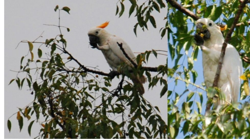
Gambar 4. Aktivitas canopy foraging Kakatua Sumba di Pohon Lamo.

berbeda ditunjukkan ketika berdampingan dengan jenis burung paruh bengkok lainnya. Kakatua Sumba cenderung menghindari jenis paruh bengkok lainnya pada saat canopy foraging (Gambar 4).