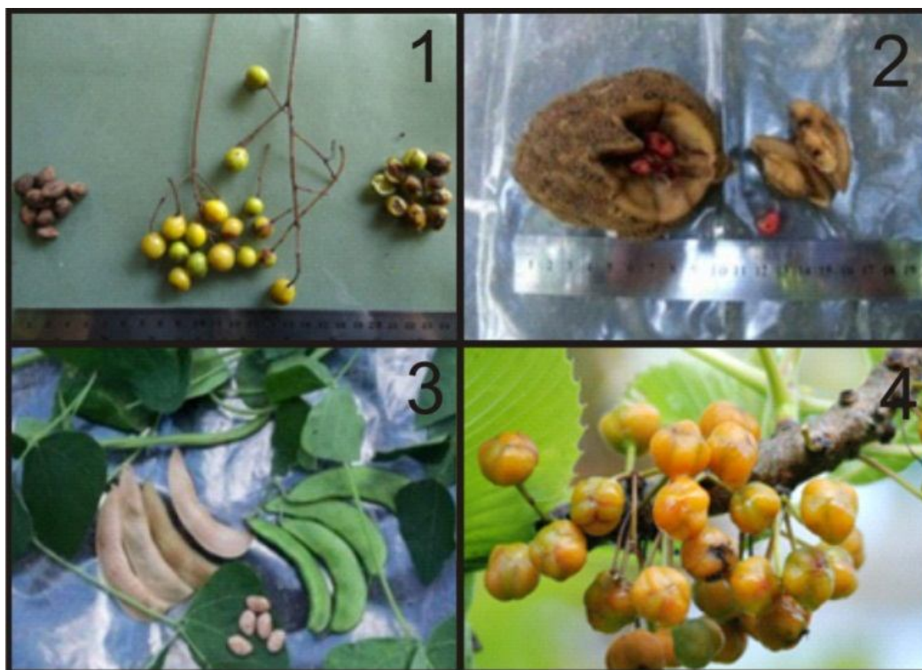
Gambar 3. Empat jenis pakan yang disukai Kakatua Sumba antara lain : (1) Lamo; (2) Kayarak; (3) Kepapang; (4) Kananggar.

kuncup, kacang-kacangan, dan kelapa ( Cocos nucifera ). Hasil penelitian terobservasi Kakatua Sumba memakan buah-buahan, biji-bijian dan nektar bunga. Menurut Renner et al. (2012) ketersediaan pakan merupakan fungsi dari tipe habitat, pengelolaan hutan oleh pihak pengelola kawasan dan musim. Kemungkinan besar masih ada jenis-jenis tumbuhan lain yang menjadi pakan Kakatua Sumba namun tidak teramati. Perbedaan periode pembuahan pada masing-masing tumbuhan menyebabkan sulitnya melakukan pengumpulan data pakan dengan waktu yang terbatas.