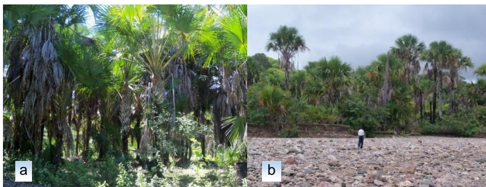
Gambar 3. a. Hutan gewang ( Corypha utan ) di Desa Nekbaun, Pulau Timor. b. Hutan gewang yang tumbuh di tepi sungai dataran rendah.

Inventarisasi potensi karbon pada hutan savana gewang dilaksanakan di Desa Nekbaun. Desa Naekbaun berada pada ketinggian sekitar 250 meter di atas permukaan laut terletak pada koordinat S10^{\circ}16'40.75'' E123^{\circ}39'42.61'' . Di Desa Naekbaun terdapat kawasan hutan yang merupakan areal savana gewang dan dikelola Dinas Kehutanan Kabupaten Kupang. Berdasarkan informasi terakhir kawasan tersebut telah di enclave . Hutan gewang terletak di tepi pantai di belakang formasi Pandanus. Luas hutan gewang di wilayah ini berkisar 100-150 ha yang didominasi oleh pohon gewang muda.