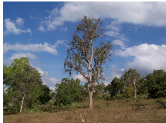
Gambar 2. Savana E. alba di Pulau Timor Figure 2. E. alba savanna in Timor island

Inventarisasi potensi simpanan karbon pada savana huek ( Eucalyptus alba ) dilakukan di beberapa lokasi di Kabupaten Timor Tengah Utara. Pohon huek di Pulau Timor memiliki bentuk batang yang mengerucut ( conoid ), dengan tingkat perubahan diameter yang drastis pada setiap ketinggian pohon atau panjang log (Yuniati dan Kurniawan, 2011).