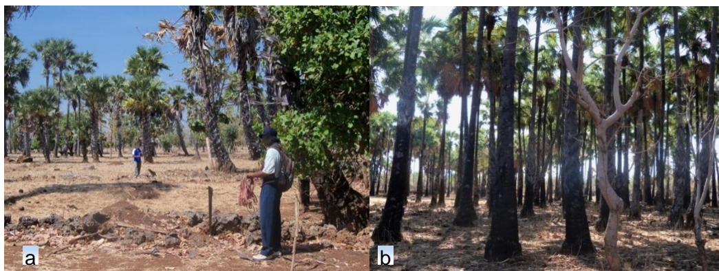
Gambar 4. a. Savana lontar ( Borassus flabellifer ) di Desa Nekbaun, Pulau Timor. b. Tegakan lontar dengan kepadatan cukup tinggi