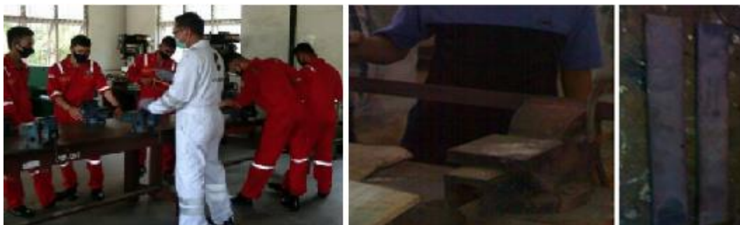
Gambar 1. Pebuatan specimen

Pembuatan specimen dan pemeriksqaan kesiapan alat/perkakas las. Bahan specimen dari besi strip ukran 2900 mm x 20mm x 4mm. Sebelum dilakukan latihan pengelasan specimen dibersihkan menggunakan amplas dan disikat agar debu yang menempel hilang. Pembuatan specimen dapat dilihat pada gambar berikut