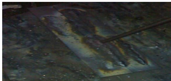
Gambar 4. Hasil pengelasan

Selanjutnya yang terakhir Pembersihan terak las dan pemeriksaan hasil lasan secara visual ( manual ). Bersihkan terak las menggunakan palu dan sikat untuk dapat melihat secara jelas hasil las. Amati hasil las secara visual. Hasil pengelasan dapat dilihat pada gambar berikut.