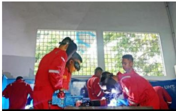
Gambar 3. Pengelasan dengan posisi down hand

Jika semuanya telah siap maka dilanjutkan dengan pengelasan specimen tersebut. Pengelasan dimulai dengan pengelasan titik dilanjutkan dengan pengelasan dengan gerak melingkar. Semuanya dilakukan dengan posisi down hand (posisi bawah tangan) seperti ditampilkan pada gambar berikut.