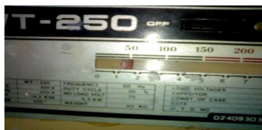
Gambar 2. Besar arus yang digunakan

Arus yang digunakan untuk elektroda dengan diameter 2,5mm adalah 60-110 amper seperti tampilan gambar berikut.