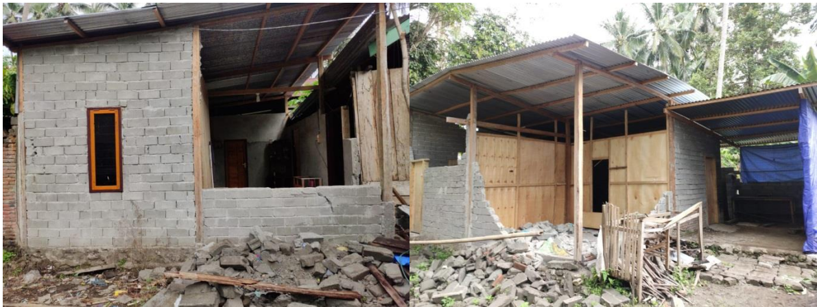
Gambar 2. Rumah di Pesisir Kabupaten Majene.

masing-masing ring balok 3,5 meter. Jika jarak antar balok ring kurang dari 3,5 meter maka dinamakan beam ring praktis yang hanya berukuran \frac{1}{5} [3]. Namun berdasarkan hasil survei diperoleh kondisi rumah penduduk seperti gambar berikut.