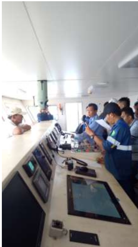
Gambar 3. Pengujian Steering Gear

Pengujian ini bertujuan untuk mengetahui waktu yang dibutuhkan kapal untuk berbelok dengan sudut tertentu sesuai ketentuan BKI, serta mengecek apakah sistem kemudi berfungsi dengan baik. Pada kapal perintis sabuk nusantara yang kami tes pada saat itu, melakukan dua jenis pengujian, pengujian pada main steering gear dan auxiliary steering test . Auxiliary steering test juga terbagi menjadi 2 macam, menggunakan roda kemudi dan solenoid yang terletak di kamar mesin.