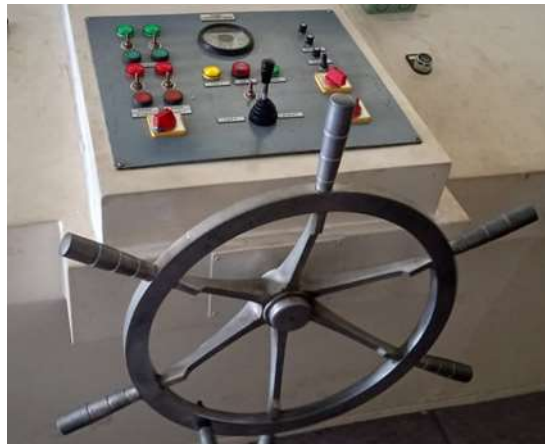
Gambar 6. Roda Kemudi