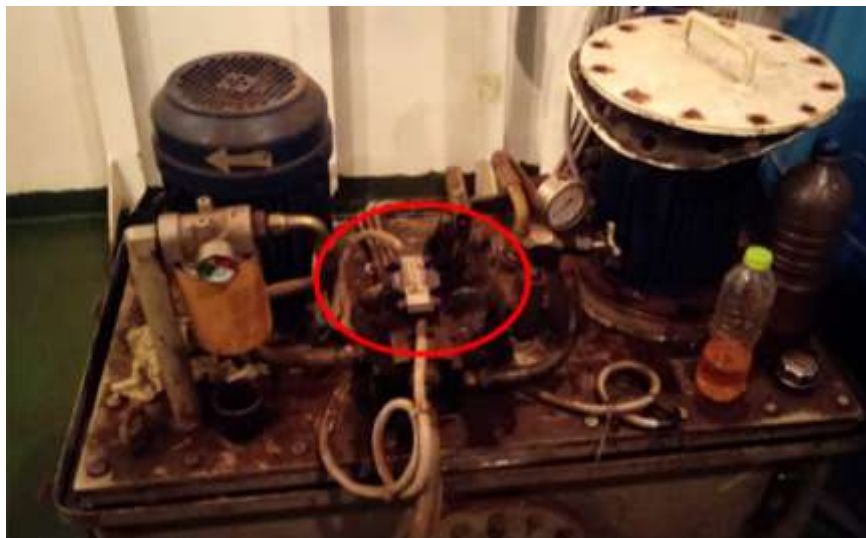
Gambar 5. Posisi Solenoid