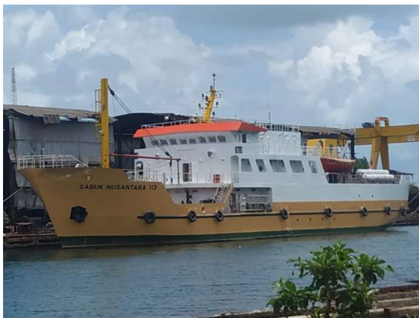
Gambar 2. Kapal Sabuk Nusantara 113