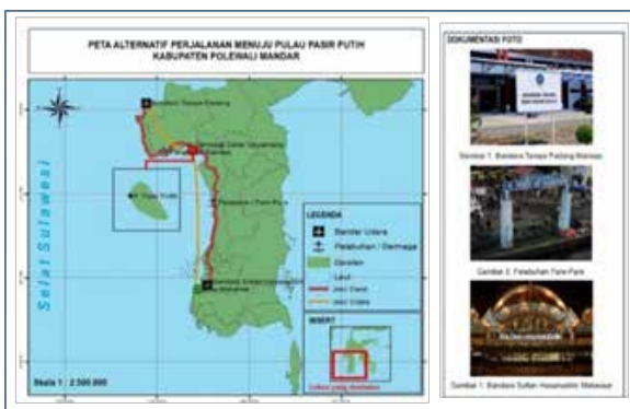
Gambar 2. Peta Alternatif transportasi menuju Pulau Pasir Putih Kabupaten Polewali Mandar

Wisatawan dapat menempuh tiga (3) alternatif perjalanan agar dapat sampai ke kawasan Pulau Pasir Putih. Pertama, dari Kota Makassar dapat ditempuh dengan perjalanan darat selama 4 sampai 5 jam; Kedua, melalui perjalanan udara dari bandar udara Sultan Hasanuddin Makassar menuju bandar udara Tampa Padang Mamuju. Perjalanan ini dapat ditempuh sekitar 45-60 menit kemudian dilanjutkan dengan perjalanan darat menuju Kabupaten Polewali Mandar sekitar 4 jam; Ketiga, melalui jalur laut menuju pelabuhan kota Pare-Pare, kemudian dilanjutkan dengan perjalanan darat sekitar 1-2 jam. Alternatif perjalanan dapat dilihat pada Gambar 2.