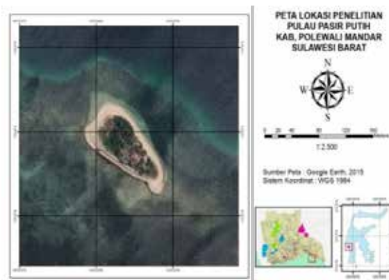
Gambar 1 Peta lokasi penelitian

Penelitian pengembangan ekowisata bahari di Pulau Pasir Putih Kabupaten Polewali Mandar ini dilaksanakan pada bulan Juli sampai Desember tahun 2015. Penelusuran dilakukan melalui survei di Pulau Pasir Putih yang merupakan salah satu kawasan konservasi maritim di Polewali Mandar. Lokasi penelitian berada di Pulau Pasir Putih, Teluk Mandar, Kabupaten Polewali Mandar, Provinsi Sulawesi Barat, dapat di lihat pada Gambar 1.