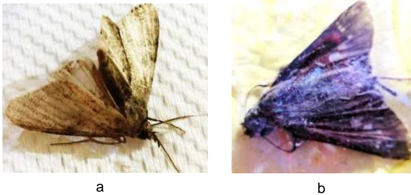
Gambar 2 : (a) Agrotis sp.dan (b) Hesperia spp.