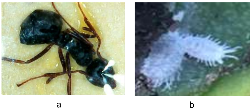
Gambar 3 : (a) Tapinoma sp. dan (b) Pseudococcus sp., Sumber : Rahmawati Arma (2020)

Sedangkan populasi hama yang ditemukan pada saat melakukan pengamatan selama 10 hari berturut-turut pada pertanaman buah naga disajikan pada Tabel 2.