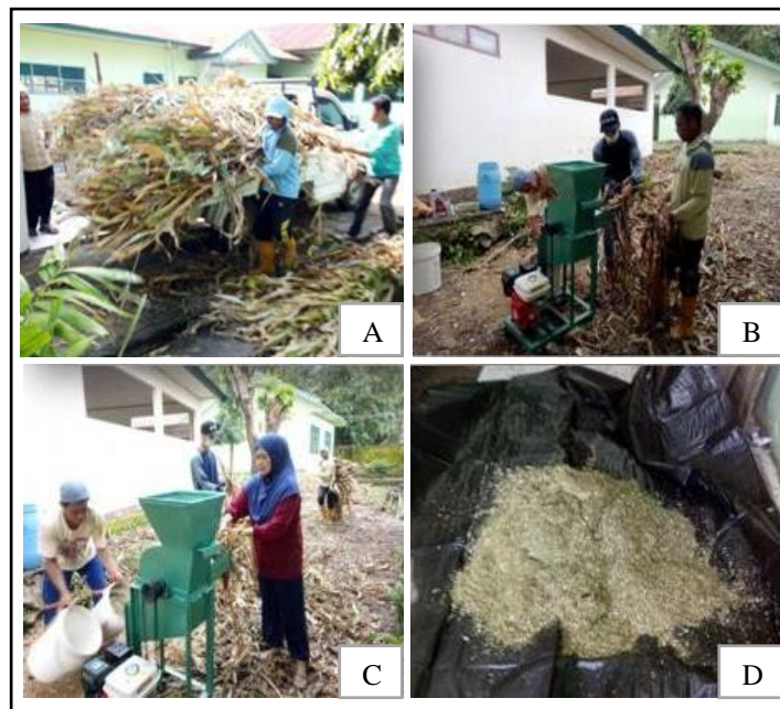
Gambar 1. Pengumpulan bahan-bahan untuk pembuatan pupuk bokashi (A); Proses pencacahan bahan pupuk Bokashi (B & C), dan hasil pencacahan bahan (D).

Gonrong-gonrong ). Bahan organik diolah dengan mesin pencacah hingga ukurannya menjadi kecil lalu dicampur hingga merata dengan dedak (Gambar 1), pupuk kandang sapi dan dekomposer (EM-4) untuk difermentasi selama lebih kurang 10 hari sampai siap untuk diaplikasikan.