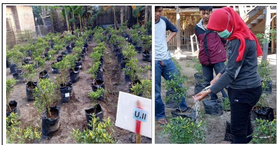
Gambar 4. Pertanaman cabai rawit saat menjelang panen di polibag.

dimana lahan sawah tidak memungkinkan untuk ditanami cabai rawit. Penanaman cabai rawit di pekarangan lebih mudah diawasi oleh petani dan dapat memenuhi kebutuhan konsumsi keluarga.