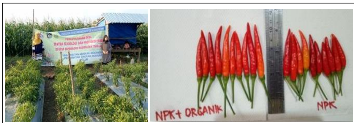
Gambar 3. Pertanaman cabai rawit menjelang panen (kiri); dan hasil panen (kanan).

ini menyamai produksi tanaman cabai rawit yang dipupuk kimia dengan dosis tinggi.