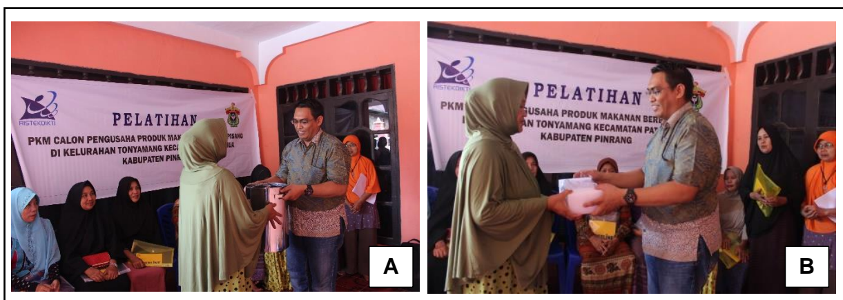
Gambar 7. Penyerahan bantuan mesin spinner (A) dan pengemas vakum (B) kepada mitra

yang diserahkan merupakan kebutuhan mitra yang diperoleh pada saat sosialisasi dan ukuran mesin spinner dan pengemas vakum cocok digunakan bagi kelompok usaha pemula.