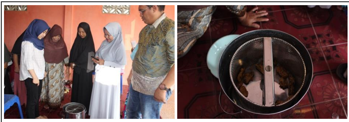
Gambar 6. Mesin spinner untuk mengurangi minyak dari pisang sale

Peserta sangat senang dengan bantuan kedua alat ini. Kedua alat tersebut dapat dimanfaatkan oleh mitra untuk membuat produk pisang sale cokelat aneka rasa bahkan bisa juga digunakan untuk membuat produk pangan olahan lainnya. Kedua alat