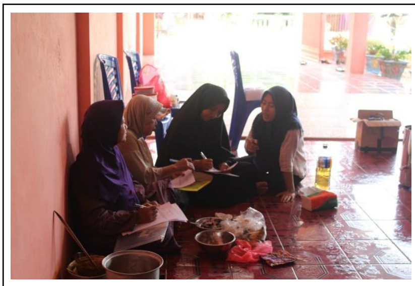
Gambar 4. Pengisian kuisisioner uji organoleptik

Rasa manis dari pisang sale coklat aroma butter dapat berasal dari buah pisang dan coklat yang digunakan. Aroma yang digunakan pada pembuatan pisang sale coklat ini tidak memiliki rasa manis sehingga tinggi rasa manis pada pisang sale coklat aroma butter 1% berasal dari pisang dan coklat yang digunakan.