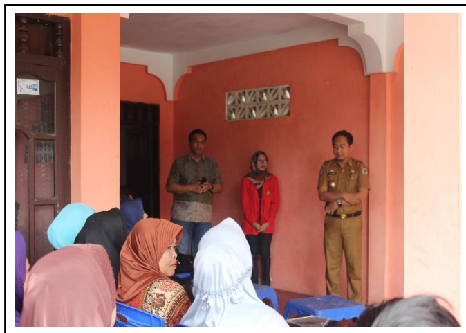
Gambar 1. Pembukaan kegiatan pengabdian oleh Kepala Lurah Tonyamang.