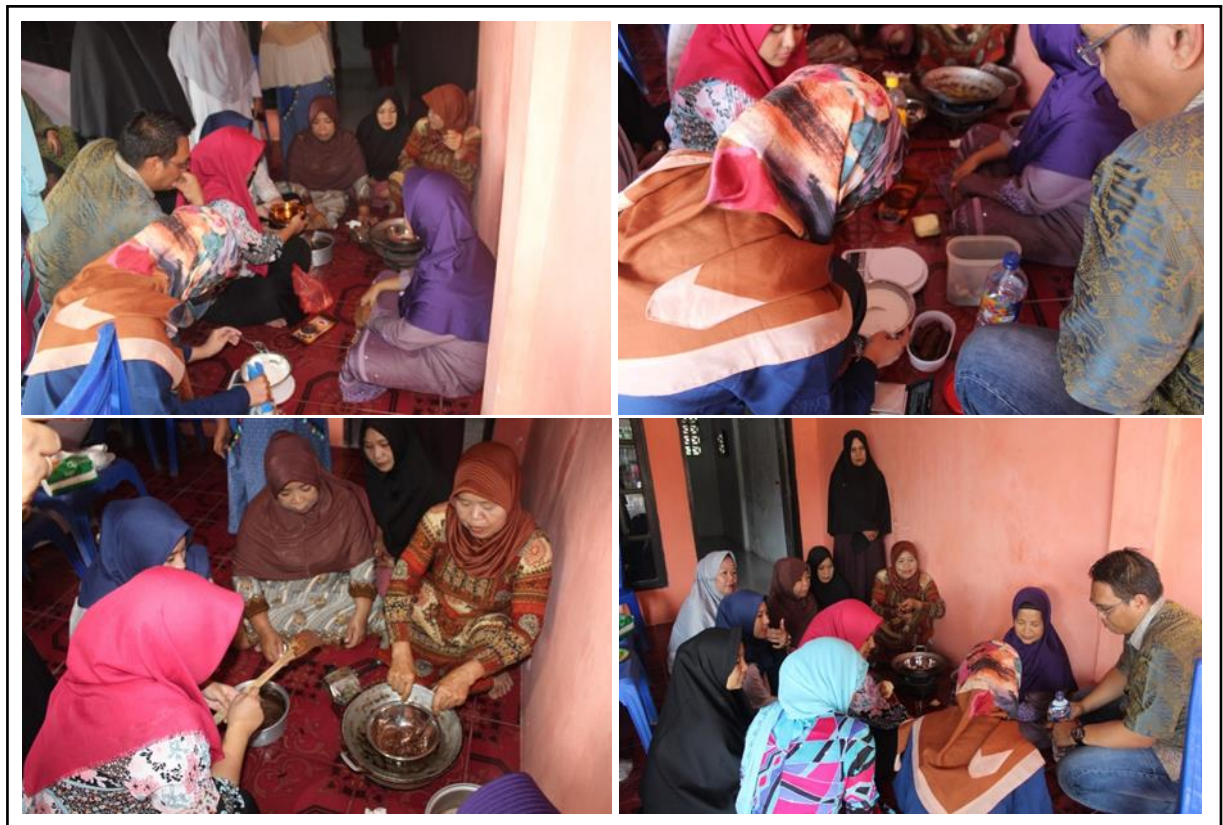
Gambar 3. Demonstrasi pembuatan pisang sale coklat aroma butter .

Pada kegiatan pembuatan pisang sale coklat aroma butter ini dilakukan bersama antar tim dan peserta. Peserta nampak sangat antusias dan aktif dalam setiap tahapan kegiatan (Gambar 3). Selama pelatihan peserta bisa berdiskusi mengenai bahan baku, penggunaan aroma dan jenis coklat yang digunakan.