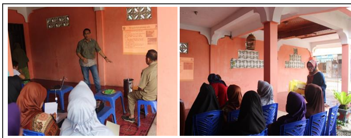
Gambar 2. Penyampaian materi oleh narasumber yang berkompeten.

Hal yang menarik selama tanya jawab antar peserta dengan narasumber adalah masih banyak ibu-ibu rumah tangga yang belum sepenuhnya mengetahui pengertian bahan-bahan aditif dan jumlah bahan aditif yang diizinkan serta bahaya dari penggunaan bahan-bahan aditif pada produk pangan olahan. Selain itu penggunaan jenis kemasan yang tepat dengan bahan yang dikemas belum sepenuhnya juga dipahami oleh peserta. Oleh karena itu pemerintah daerah dalam hal ini pemerintah daerah Kabupaten Pinrang perlu melakukan sosialisasi penggunaan bahan-bahan aditif