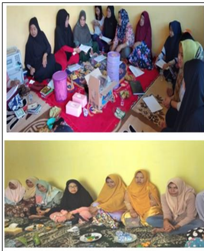
Gambar 3. Kegiatan Sosialisasi.

Pada tahap ini respon positif diberikan oleh para ibu-ibu rumah tangga, mereka secara langsung menyatakan kesiapannya untuk mengikuti pelatihan pembuatan nugget ikan Lele dan kerupuk tulang Lele pada pertemuan berikutnya melalui sesi pelatihan dan tutorial yang akan dipandu langsung oleh tim pelaksana.