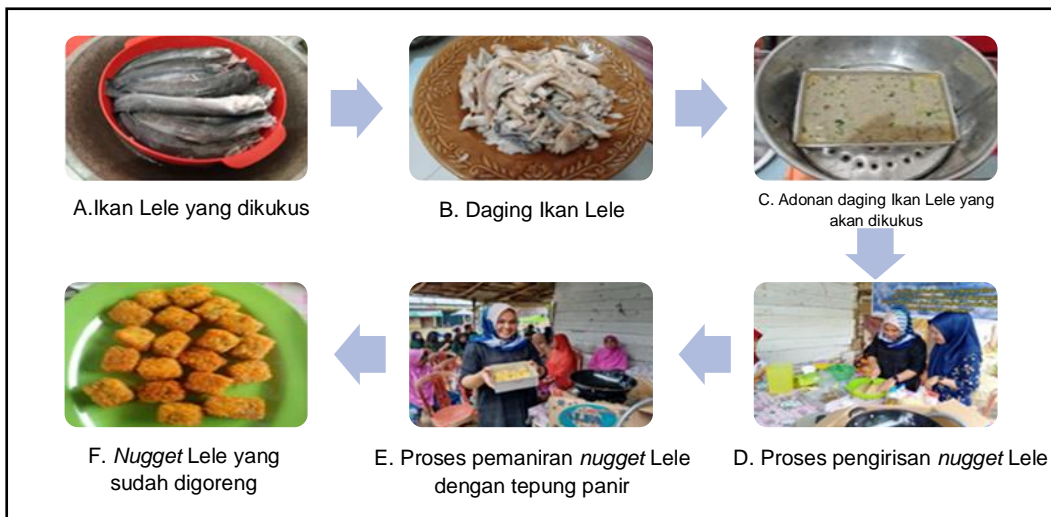
Gambar 4. Tahapan pembuatan nugget Lele: (A)

Kesemua bahan baku nugget Lele tersebut, kemudian dicampur menjadi satu adonan, aduk hingga rata dan selanjutnya adonan nugget dimasukkan ke dalam loyang aluminium persegi, dan dikukus selama 15 menit, hingga adonan matang dan mengembang. Setelah adonan nugget Lele matang dan dingin, lalu diiris-iris dan dibalurkan pada celupan telur dan tepung panir. Nugget lele lalu siap untuk di goreng (Gambar 4).