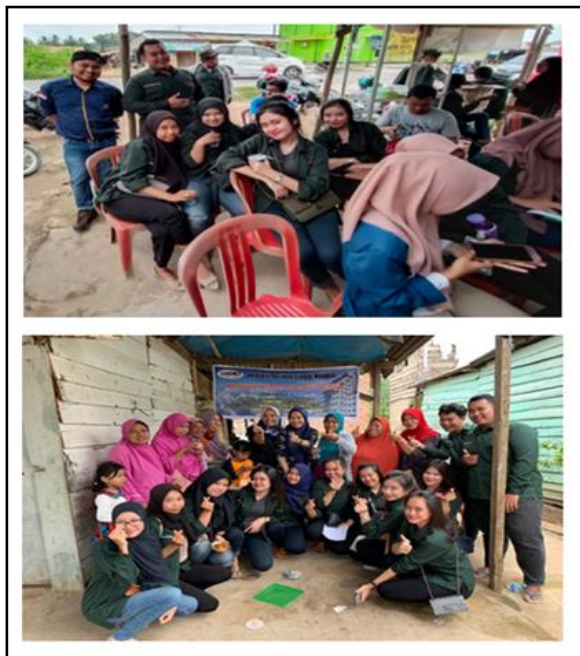
Gambar 2. Kegiatan Observasi.

buruh. Secara spesifik kegiatan pemberdayaan yang dilakukan adalah dengan melakukan pengolahan nugget ikan Lele dan kerupuk tulang Lele melalui metode zero waste process .