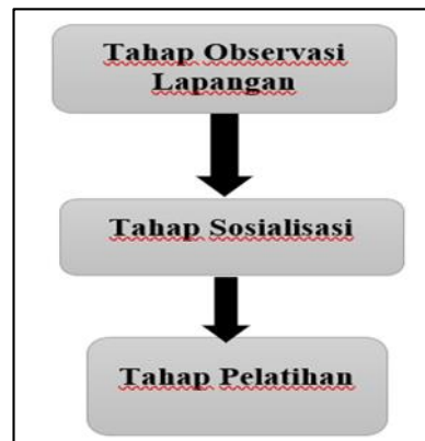
Gambar 1. Bagan tahapan metode kegiatan.