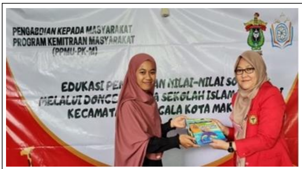
Gambar 4. Donasi Buku Dongeng.

sejumlah 80 buku pada hari ketiga rangkaian kegiatan ini. Hal ini diharapkan mampu memotivasi para siswa untuk membaca dongeng sejak dini. (Gambar 4).