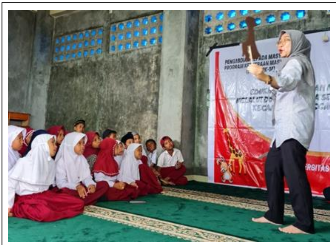
Gambar 3. Mendongeng Jerapah dan Kelinci.

meloncat juga tidak mampu melewatinya. Namun Kelinci melihat ada lubang kecil di bawah tembok kayu tersebut, dan dengan lincahnya Kelinci melewati lubang tersebut dan berhasil menyebrangi tembok itu. Maka pada tantangan tersebut, Kelincilah pemenangnya. Diakhir cerita, Kelinci dan jerapah menyadari bahwa mereka masing-masing mempunyai kekurangan dan kelebihan. Mereka juga menyadari kesombongan tidak akan membawa kebaikan. Dari dongeng tersebut mengajarkan bahwa sepatutnya kita menghindari sikap sombong, tidak mencela kekurangan orang lain, dan menyadari bahwa tiap makhluk diciptakan dengan kelebihan dan kekurangannya masing-masing (Gambar 3).