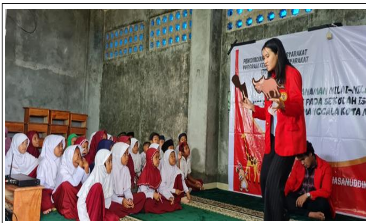
Gambar 2. Pembacaan Dongeng Interaktif.

contoh-contoh perilaku negatif yang harus dihindari, diantaranya jangan memperbudak orang lain dan jangan serakah. Selain itu, dongeng ini juga mengajarkan hal-hal yang harus dilakukan ketika kita berbuat salah diantaranya menyadari kesalahan tersebut, meminta maaf, berbagi dengan sesama, serta tidak mengulangi kesalahan yang pernah dilakukan.