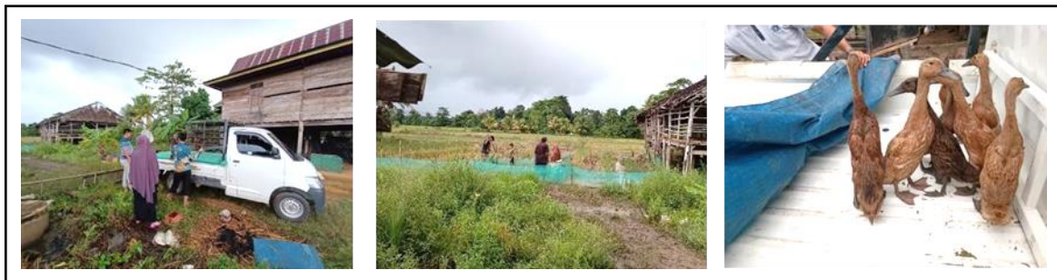
Gambar 7. Pengangkutan Ternak Itik dari Produsen/Peternak Itik.

ini dilakukan dikarenakan ternak Itik membutuhkan perhatian khusus setiap hari, baik proses pemberian pakan yang dilakukan setiap hari sebanyak dua kali (pagi dan sore hari), pemberian air minum secara ad libitum . Kegiatan lain yang dilakukan selanjutnya adalah kegitan penyuluhan dan pengolahan produk asal ikan.