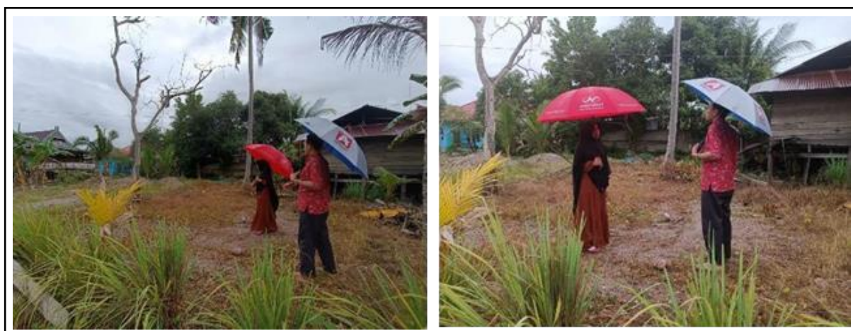
Gambar 3. Survei Lokasi Pembangunan Kandang Pemeliharaan Ternak Itik.