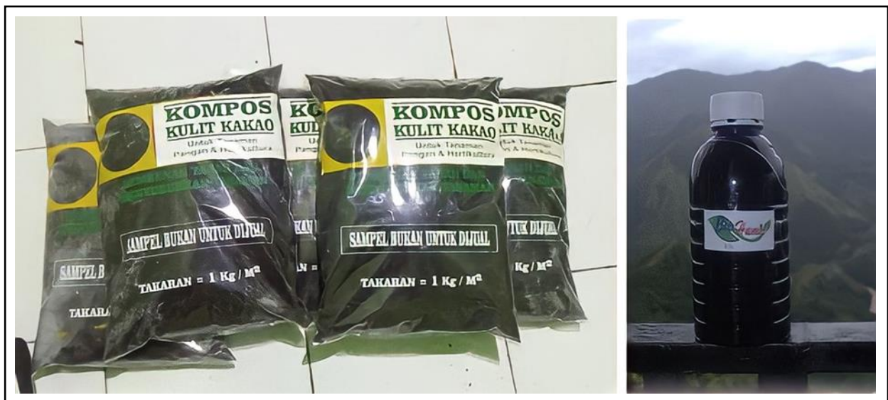
Gambar 6. Produk biostimulan organik dari limbah kulit buah kakao berupa kompos dan biohumik.

Produk yang dihasilkan merupakan salah satu luaran kegiatan Matching Fund 2022 dengan judul Scale up produksi biostimulan organik menuju komersialisasi, yang melibatkan dosen multidisiplin dari Prodi Agroteknologi dan Agribisnis Fapet-