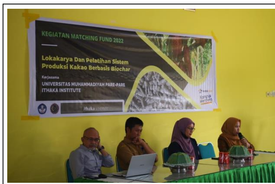
Gambar 2. Lokakarya Produksi Kakao Sehat Menggunakan Bahan Organik.

Survei pengetahuan petani dilakukan dengan menyebarkan kuisioner dan wawancara. Wawancara dilakukan oleh mahasiswa Prodi Agribisnis Fakultas Pertanian, Peternakan, dan Perikanan (Fapetrik) Universitas Muhammadiyah Parepare (UMPAR) kepada 22 orang responden yang dipilih secara acak. Responden merupakan anggota kelompok tani yang mengikuti kegiatan sosialisasi dan penyuluhan bahan organik yang dilaksanakan di aula kantor Dinas Pertanian Kabupaten Soppeng (Gambar 3).