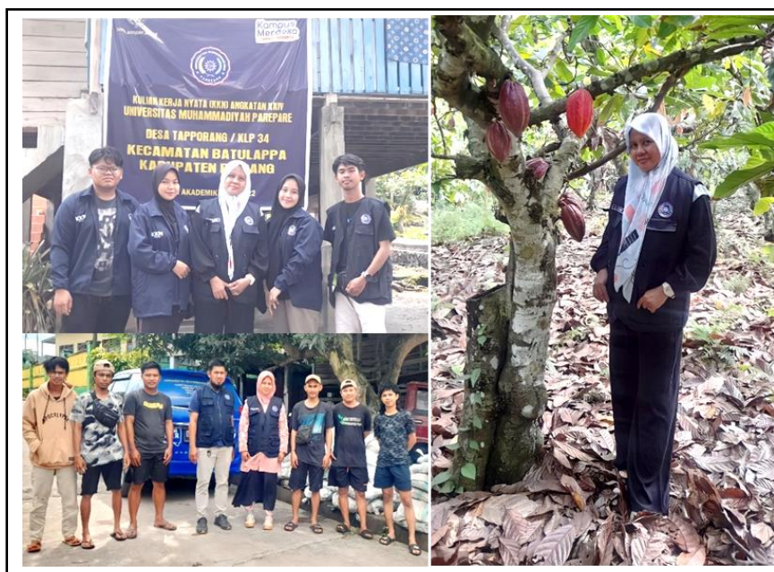
Gambar 1. Survei Lokasi Pertanaman Kakao di Kabupaten Pinrang Melibatkan Mahasiswa KKN UMPAR Dilanjutkan Pertemuan Dengan Kelompok Tani Mallongi-longi Desa Tapporang Kabupaten Pinrang, Sulsel.

Kelompok tani memastikan dapat memasok 1 ton kulit buah kakao per satu kali produksi. Limbah kulit buah kakao akan dibuat kompos yang kemudian diekstrak untuk menjadi biostimulan organik. Pada pertemuan dengan kelompok tani, dibuat kesepakatan harga berdasarkan perhitungan biaya transpor menggunakan motor taksi. Motor taksi ini adalah kendaraan roda dua yang telah dimodifikasi untuk menjelajahi medan sulit dan mempunyai rangka yang bisa membawa beban berat. Lokasi kakao ada di daerah yang sulit dijangkau kendaraan roda empat.