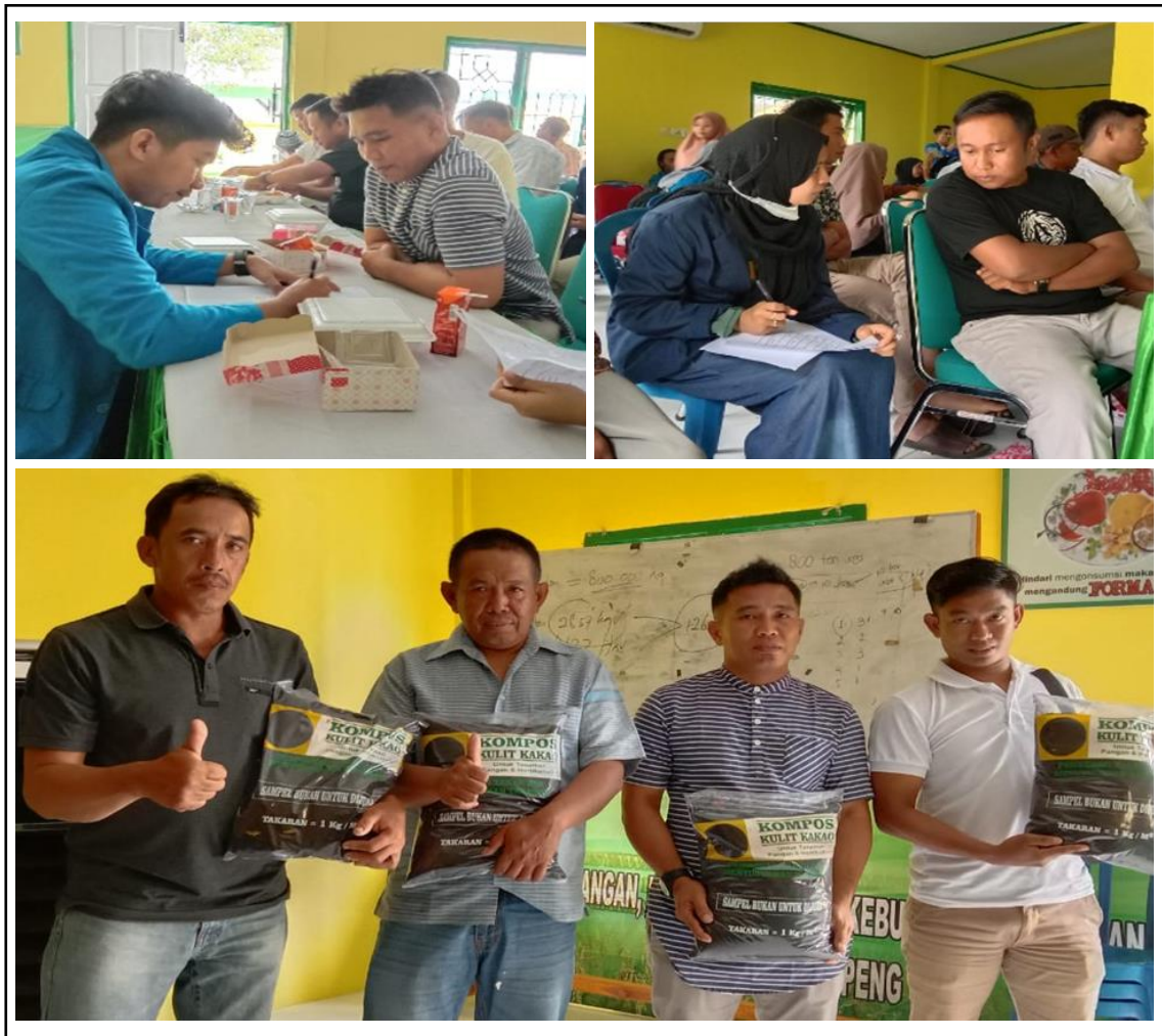
Gambar 3. Sosialisasi dan Penyuluhan Bahan Organik yang Dilaksanakan di Aula Kantor Dinas Pertanian Kabupaten Soppeng.