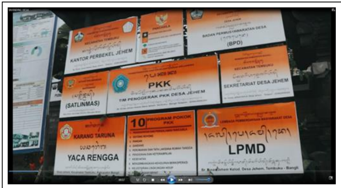
Gambar 4. Hasil Video untuk Marketing Desa Jhem.