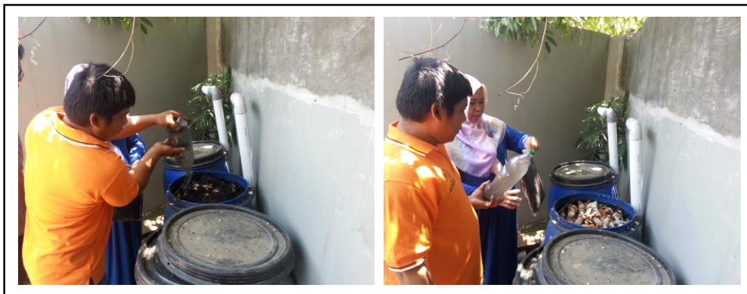
Gambar 6. Pelatihan Pembuatan Kompos dari Sampah Organik Menggunakan Bakteri Anaerob

Dengan adanya diversifikasi pengelolaan sampah dari hanya melakukan pengolahan sampah anorganik menjadi pengolahan kedua jenis sampah (anorganik dan organik), maka perlu dipikirkan bentuk pengelolaan bank sampah yang baru dengan memasukkan pengolahan sampah organik menjadi kompos.