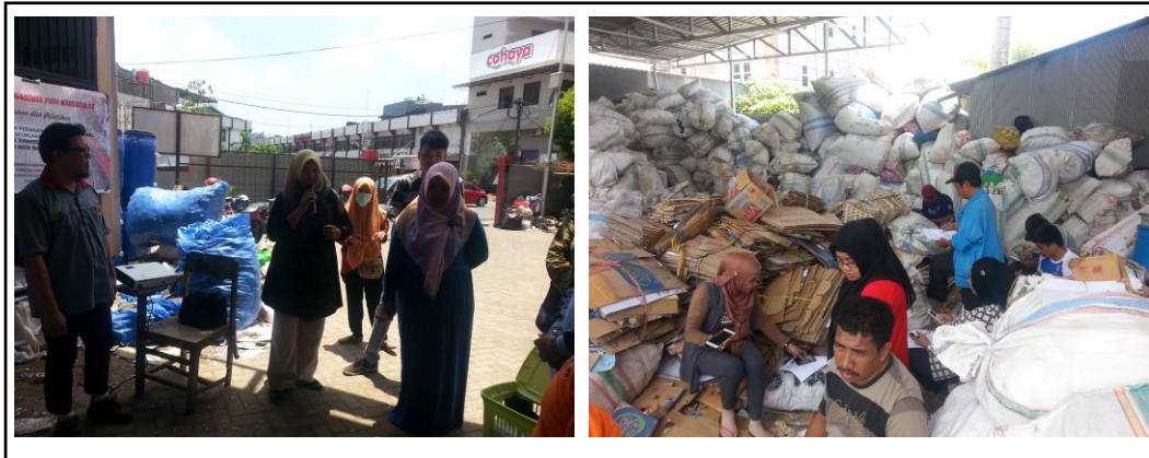
Gambar 5. Pelaksanaan Penyuluhan Pengelolaan Sampah Organik pada Bank Sampah Pusat Toddopuli

nama/merk kompos, berat bersih isi kompos dalam kemasan dan komposisi unsur yang terkandung dalam kompos.