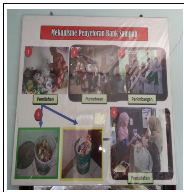
Gambar 2 Mekanisme Penyetoran Sampah Anorganik pada Bank Sampah Pusat Toddopuli Makassar

2) karena hanya melibatkan pemilahan atau penyortiran jenis sampah anorganik yang dibawa oleh warga sesuai spesifikasi yang ditetapkan oleh bank sampah (Gambar 3), penyetoran dan penimbangan serta pencatatan pada buku tabungan. Untuk mengoptimalkan peran bank sampah ini, perlu dipikirkan alternatif untuk diversifikasi pengolahan sampah yakni pengelolaan sampah organik menjadi kompos atau POC sampai pada produk yang dikemas dan siap jual.