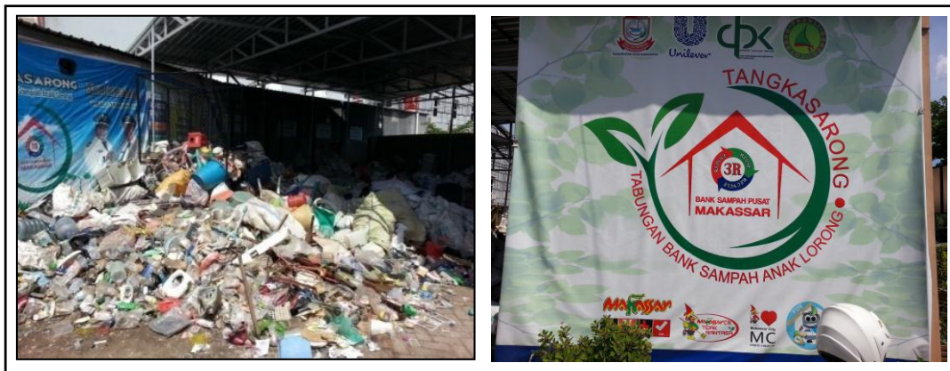
Gambar 1. Sampah Anorganik (Kiri) yang Disetor Warga ke Bank Sampah Pusat Toddopuli (Kanan)

Walaupun tujuan pendirian bank sampah ini adalah untuk membantu mengurangi volume sampah terangkut ke TPA Tamangapa, namun jenis sampah yang dikelola baru sebatas sampah anorganik seperti plastik, kaleng dan sejenisnya (Gambar 1) dan belum mengelola sampah organik. Menurut Mallongi dan Saleh (2015), sampah organik tersusun dari bahan-bahan penyusun tumbuhan dan hewan yang diambil dari alam atau dihasilkan dari kegiatan rumah tangga, pertanian, perkantoran, dan kegiatan lain. Sampah jenis ini dapat dengan mudah diuraikan dalam proses alami. Sebagian besar sampah rumah tangga merupakan bahan organik seperti limbah olahan dapur seperti sisa makanan, sayuran, kulit buah, rempah-rempah dan lain-lain.