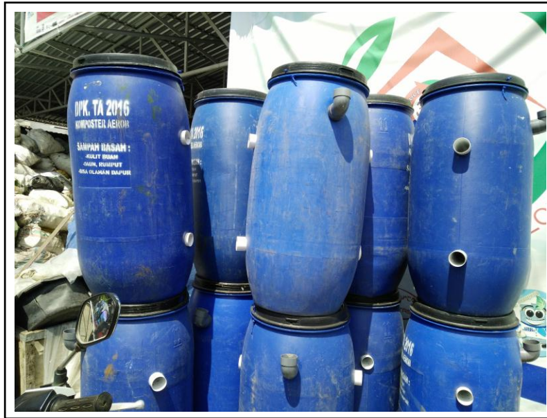
Gambar 4. Komposter yang Siap didistribusikan pada Bank Sampah Unit

Dari uraian di atas, beberapa permasalahan mitra yang diprioritas untuk diangkat dalam kegiatan pengabdian masyarakat ini dapat dirumuskan sebagai berikut: