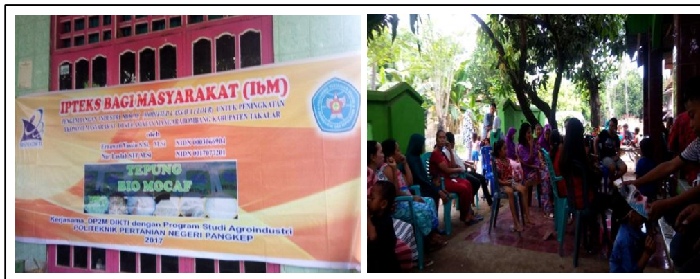
Gambar 2. Kegiatan sosialisasi pengenalan tepung mocaf pada mitra

Demikian pula sosialisasi terhadap para peserta dilakukan oleh pihak mitra (Gambar 2). Persiapan tempat baik pada saat penyuluhan maupun pelatihan pembuatan tepung mocaf juga dilakukan oleh mitra. Bahan baku berupa singkong segar juga akan disediakan oleh mitra.