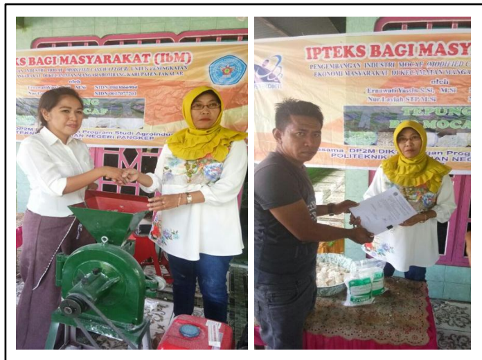
Gambar 7. Penyerahan dan penandatanganan bantuan peralatan pada mitra 1(kiri) dan mitra 2 (kanan).