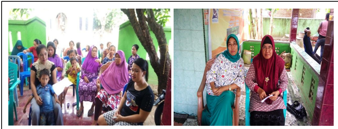
Gambar 3. Antusias kedua mitra dalam mengikuti kegiatan penyuluhan

Penyuluhan diberikan dengan cara ceramah dengan bantuan tayangan dengan LCD dan program Microsoft Powerpoint . Selain itu para peserta juga diberikan materi secara tertulis (dalam bentuk makalah) yang dibagikan. Makalah berisi cara pembuatan tepung mocaf. Untuk mengetahui tingkat pemahaman para peserta sebelum dan sesudah penyuluhan dilakukan evaluasi terhadap tingkat pemahaman para peserta (Gambar 3).