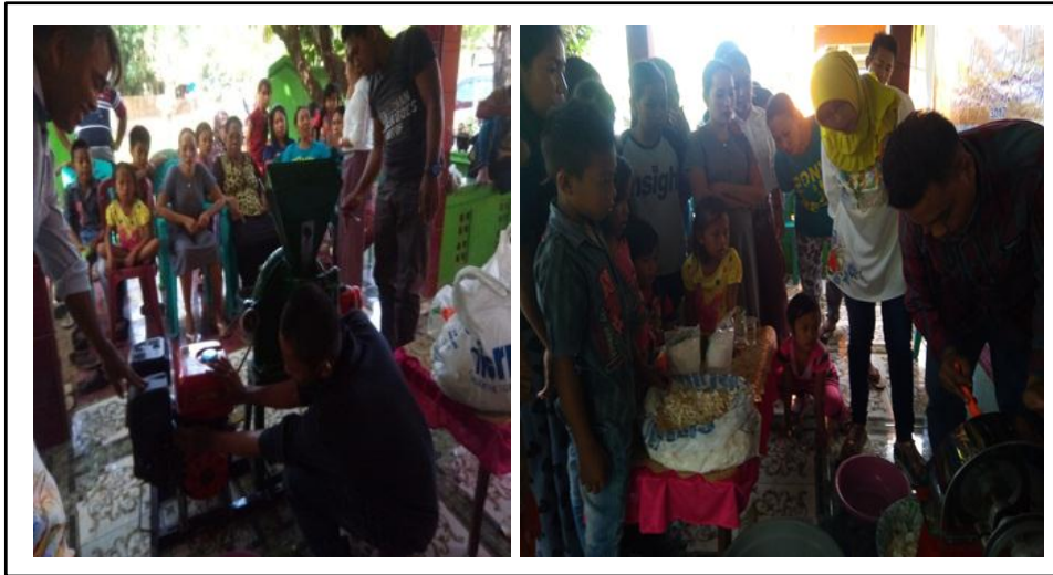
Gambar 5. Partisipasi mitra dalam pelatihan pembuatan tepung mocaf