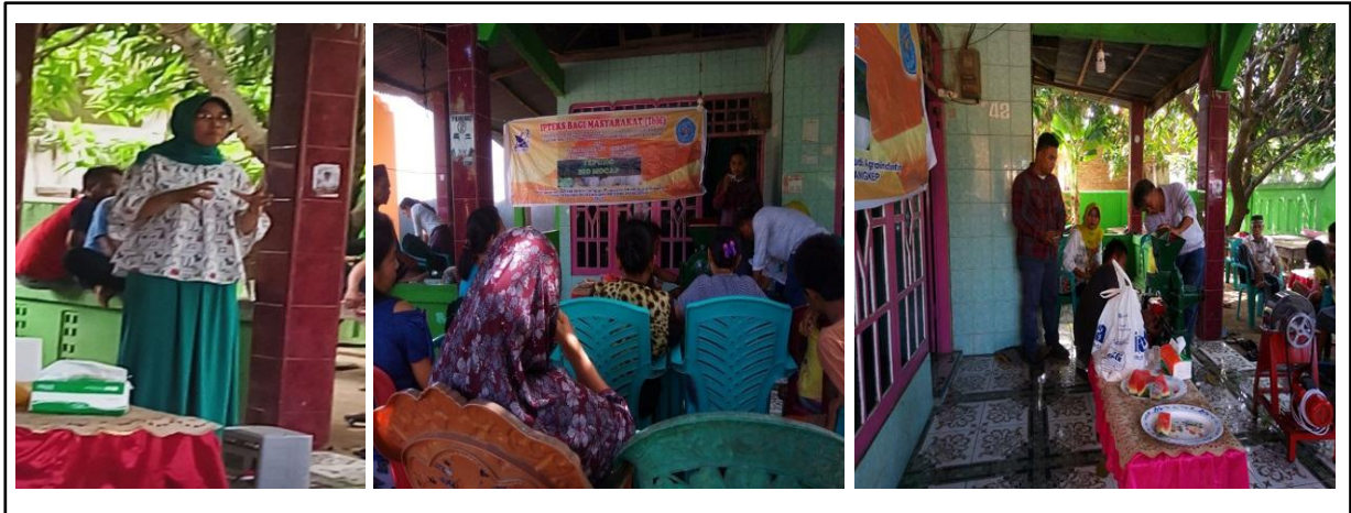
Gambar 4. Kegiatan pelatihan pengolahan tepung mocaf yang diawali dengan penjelasan tentang tepung mocaf (kiri dan tengah) dan pemanfaatan dalam pengolahan (kanan).

Dalam kegiatan praktik ini, petani awalnya diberikan contoh, kemudian mereka mengulangi kembali melakukan sesuai dengan apa yang telah dicontohkan.