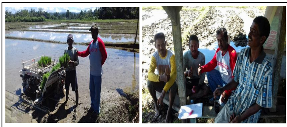
Gambar 3. Tahapan Penanaman Padi (Kiri) dan Diskusi dengan petani (Kanan).