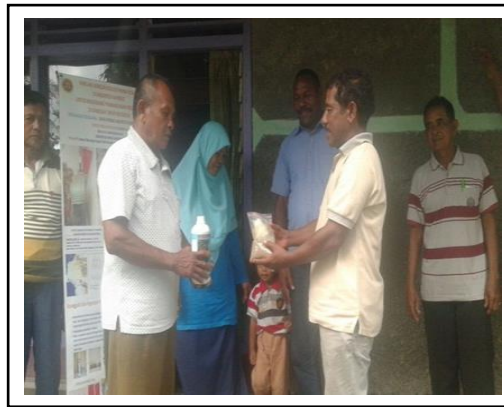
Gambar 2. Penyerahan Produk Pupuk kepada Petani

Pendampingan kepada petani juga dilakukan selama dalam tahapan penanaman sampai produksi tanaman pada demplot dalam bentuk diskusi dengan petani untuk mengevaluasi pelaksanaan demplot dan mengidentifikasi permasalahan yang timbul (Gambar 3).