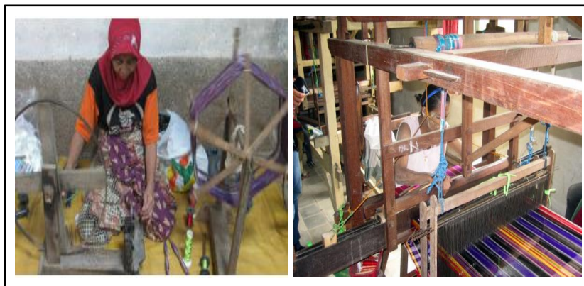
Gambar 1. Proses penenunan sutera dengan menggunakan Alat Tenun Bukan Mesin (ATBM)

Proses pembuatan kain sutera polos, umumnya memakan waktu selama sebulan, mulai dari pemintalan benang sampai menjadi sarung atau produk tenun lainnya. Benang dari ulat sutera setelah dipintal, direndam dalam air mendidih selama 15 menit hingga warnanya putih bersih. Selanjutnya, benang itu dicelupkan ke cairan pewarna, sesuai warna yang diinginkan. Lalu benang yang sudah diwarnai itu, diangin-anginkan dan tidak boleh terkena sinar matahari secara langsung. Selanjutnya diberi kanji agar benang menjadi licin dan tidak berbulu saat ditenun. Kemudian memasukkan helai-helai benang pada alat serupa sisir (Gambar 1).