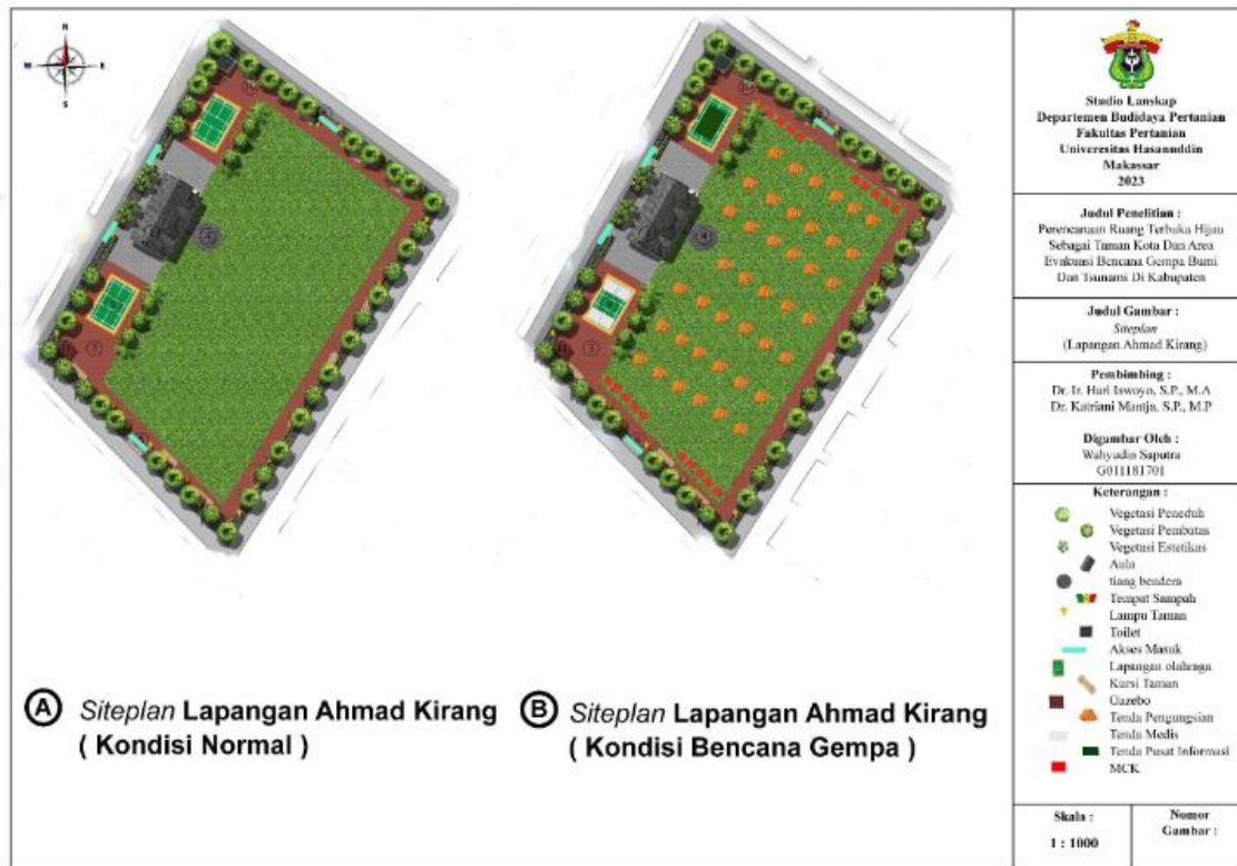
Gambar 2. Rencana tapak ( site plan ) Lapangan Ahmad Kirang